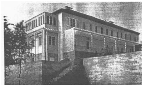
Verwaltungsgebäude und Wohnhaus für Rektor und Renspreiter. An der Südseite im Erd- und Obergeschoss befindet sich ein geschlossener Voranda und an der Südseite im Erdgeschoss eine durchlaufende Pergola. Kramer hatte hier das Pergola-Element, das Tessenow für den gesamten Gartenhof geplant hatte, weitergeführt.

tung des Lands- und Amtsgerichtes am Münchner Platz in Dresden (heute TU Dresden). 1909 versetzte man ihn in das Hochsbauamt des Sächsischen Finanzministeriums. Zum Finanz- und Baurat ernannte man ihn 1914 und 1919 wird er zum Oberbaurat ernannt. Seine Laufbahn gipfelte 1920 in der Übernahme der Leitung des Hochbauamtes. Als Ministerialrat prägte Oskar Kramer über viele Jahre das staatliche Bauschaffen in Sachsen und lieferte ebenfalls Entwürfe für viele bedeutende sächsische Projekte und Bauten, so u. a. das Veterinärmedizinische Institut der Universität Leipzig, Braunkohleforschungsinstitut der Bergakademie Freiberg, Neubau der Landesschule in Dresden-Klotzsche zusammen mit Heinrich Tessenow (heute Königsbrücker Landstraße),