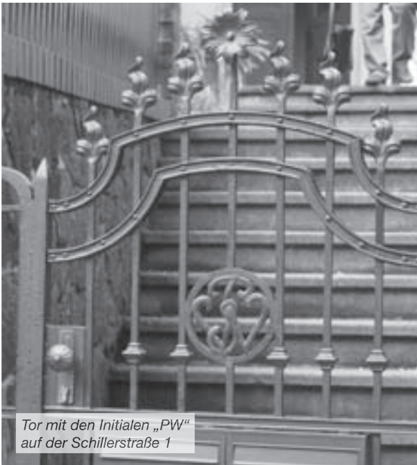
Tor mit den Initialen „PW“ auf der Schillerstraße 1

Einen spannenden Rundgang bietet die Ortsgruppe des Landesvereins Sächsischer Heimatschutz e. V. allen Interessierten zum diesjährigen Tag des offenen Denkmals. Zunächst führt die Tour auf den Spuren von Initialen von der Forststraße über die Beethoven- und Nicodéstraße bis zur Höntzschstraße. Initiale waren besonders im ersten Viertel des 20. Jahrhunderts als Bauschmuck sehr beliebt. Meist bestanden sie aus den Anfangsbuchstaben des Namens der Bauherren. Wir Heutigen gehen oftmals achtlos daran vorüber, da wir nichts damit anzufangen wissen. Auf dem Spaziergang ist zu erfahren, wer sich hinter den Buchstaben an oder über Türen und in Toren verbirgt.