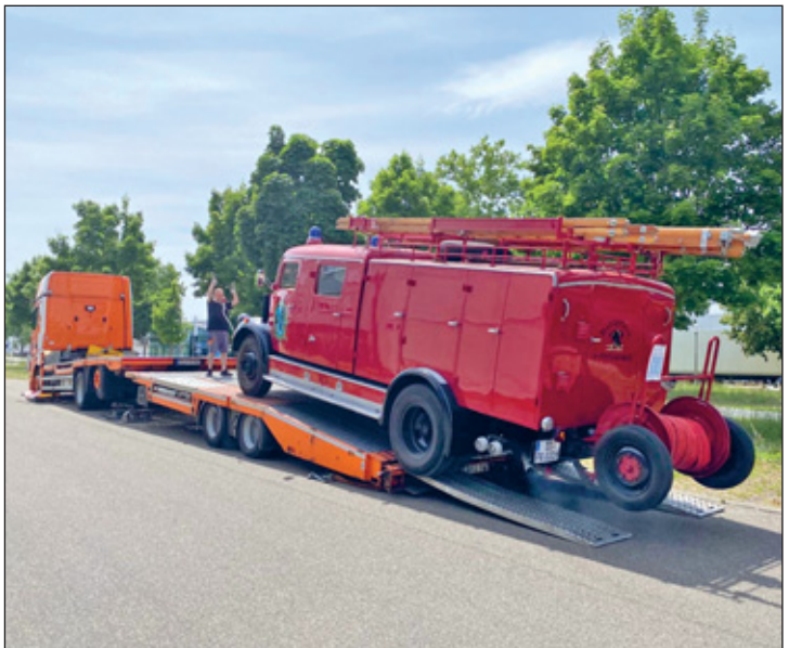
Die Entfernung von 563 km musste das LF 16, Baujahr 1956, nicht ohne Hilfe zurücklegen