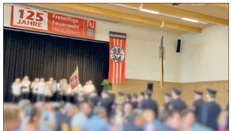
Einmarsch der Neulußheimer Feuerwehr zum Festempfang am 23. Mai 2025 – Foto: Copyright (c) 2025 Lutz Kretschmar