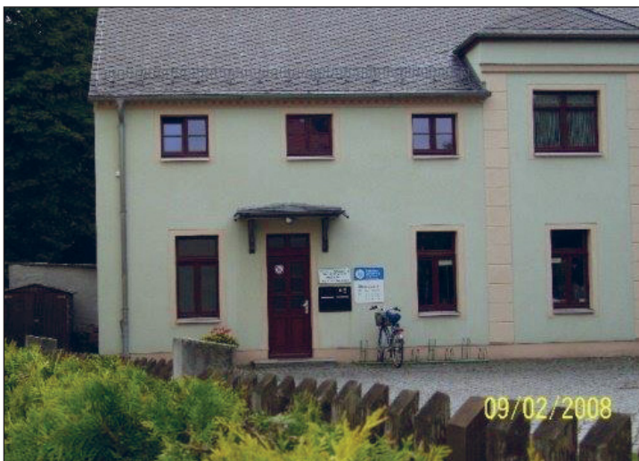
Weißiger Str. 5

Zusätzlich zur Ausleihe von Büchern gibt es auch das Angebot für DVDs. Die Bibliothek wird sehr gut angenommen, z.Z. gibt es ca. 550 Leserinnen und Leser.