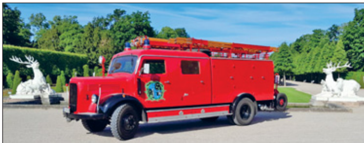
Fotoshooting im Schlossgarten Schwetzingen