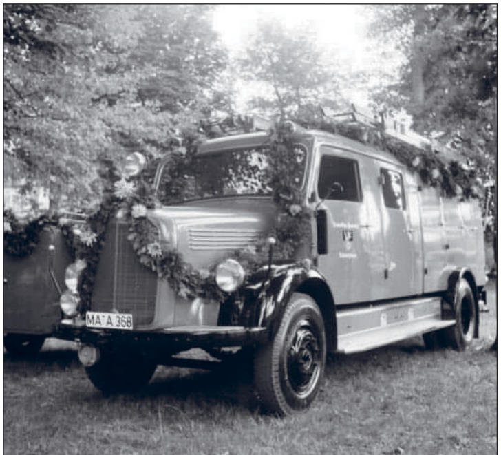
Das LF 16, der "Benz", bei seiner Indienststellung in Schwetzingen 1956