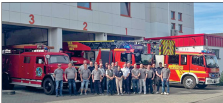
Gruppenfoto an der Feuerwache in Schwetzingen