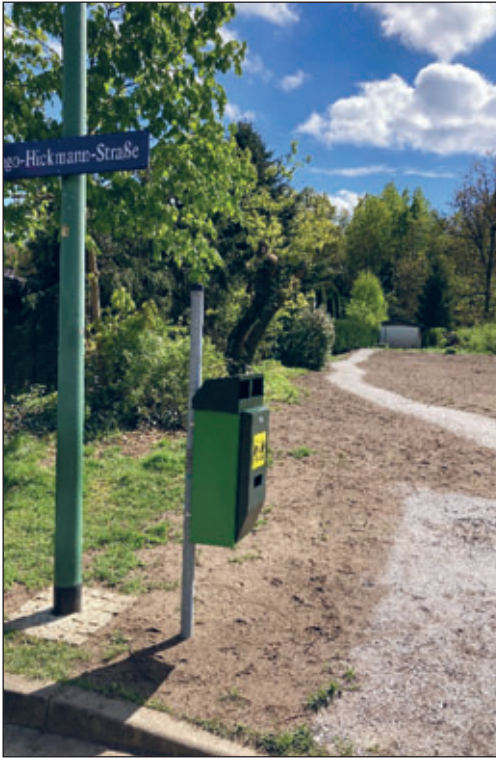
Standort Hugo-Hickmann Straße