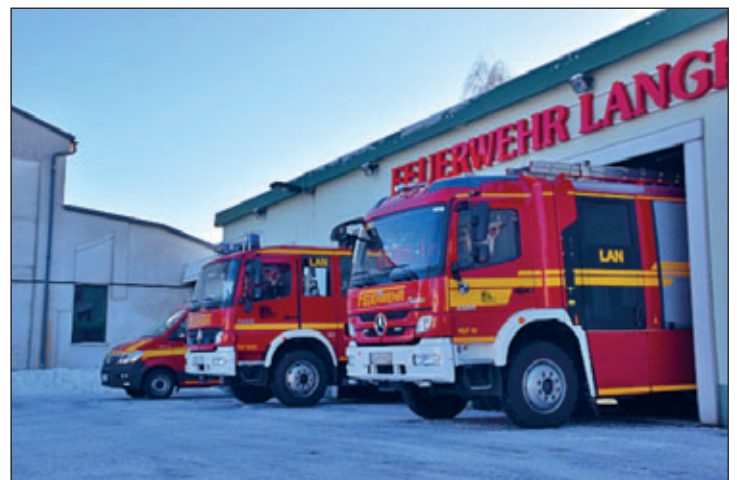
Einsatzfahrzeuge der Feuerwehr Langebrück im Januar 2024