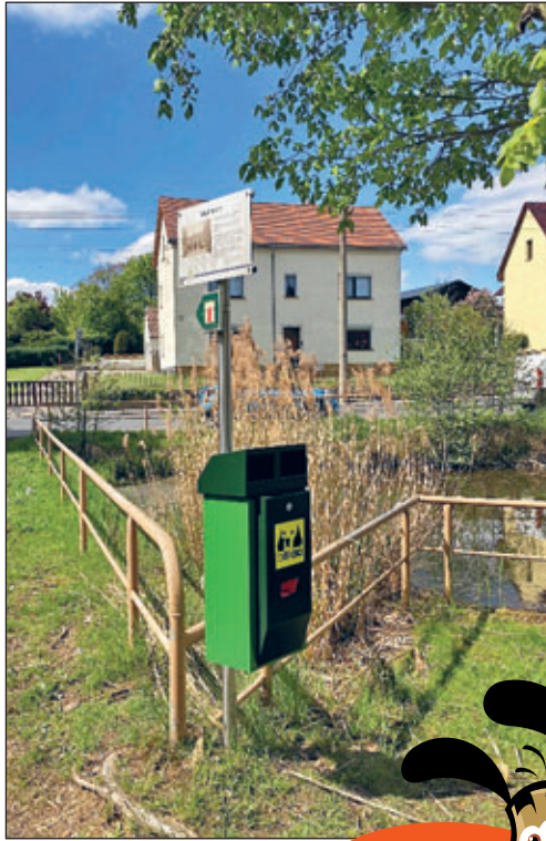
Standort am Mühlteich

Durch die Verwaltungsstelle Langebrück wurden zwei neue Hundetoiletten angeschafft.