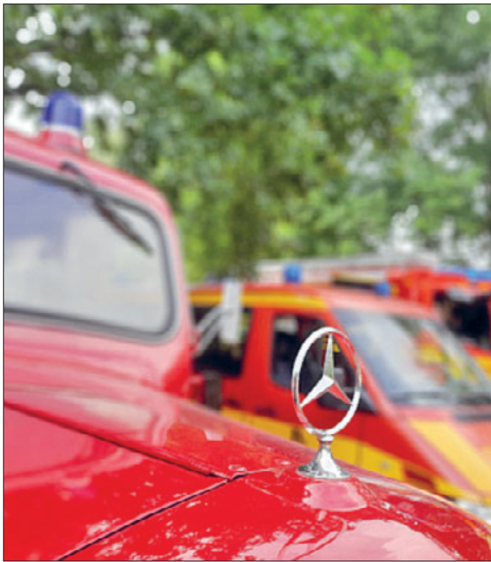
Präsentation des historischen und der modernen Einsatzfahrzeuge zum Familienfest im Bad