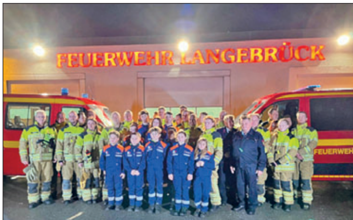
Kameradinnen und Kameraden der Feuerwehr, Jugendfeuerwehr und Alters- und Ehrenabteilung bei der Fahrzeugübergabe im Dezember 2023