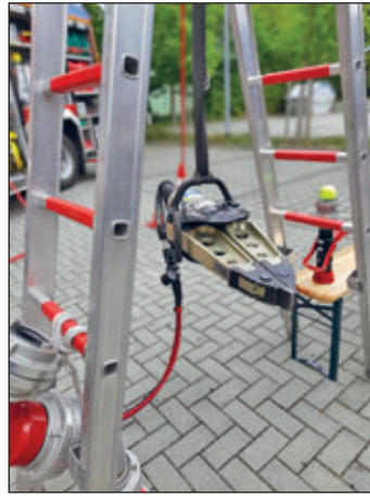
Zum Tag der offenen Firmentüren konnte Einsatztechnik ausprobiert werden