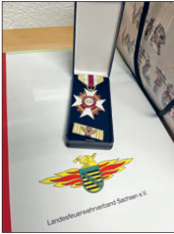
Auszeichnung für 60 Jahre im Dienst der Feuerwehr