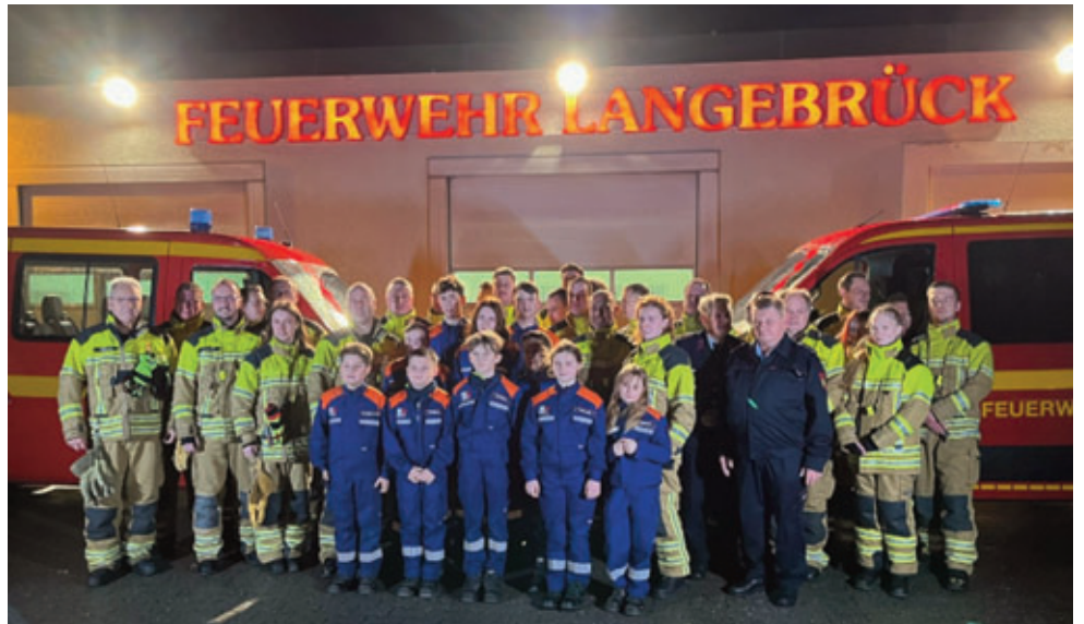
Kameradinnen und Kameraden der Feuerwehr, Jugendfeuerwehr und Alters- und Ehrenabteilung bei der Fahrzeugübergabe

Der moderne Transporter bietet Platz für bis zu 8 Einsatzkräfte. Herausnehmbare Sitze sowie Regalsysteme erlauben dabei größtmögliche