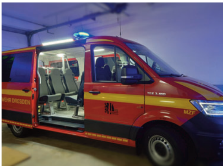
Das neue MZF (Mehrzweckfahrzeug)

Flexibilität, um jederzeit dem breiten Aufgabenspektrum der Feuerwehr sowie den Bedürfnissen der Jugendfeuerwehr angepasst werden zu können. Angeschafft wurde das Fahrzeug insbesondere, um die Stadtteilfeuerwehr für ihre Einsätze als Teil des Gefahrgutzugs der Feuerwehr Dresden zu rüsten, schließlich ist sie dort für das Messen, also die Entnahme von Messproben in der Umgebung des Einsatzgeschehens, zuständig. Der Neuwagen gibt nun den nötigen Raum für modernste Messtechnik und die bei Messeinsätzen notwendige Ausrüstung.