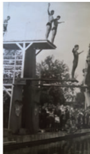
1950 Badfest 5m Turm