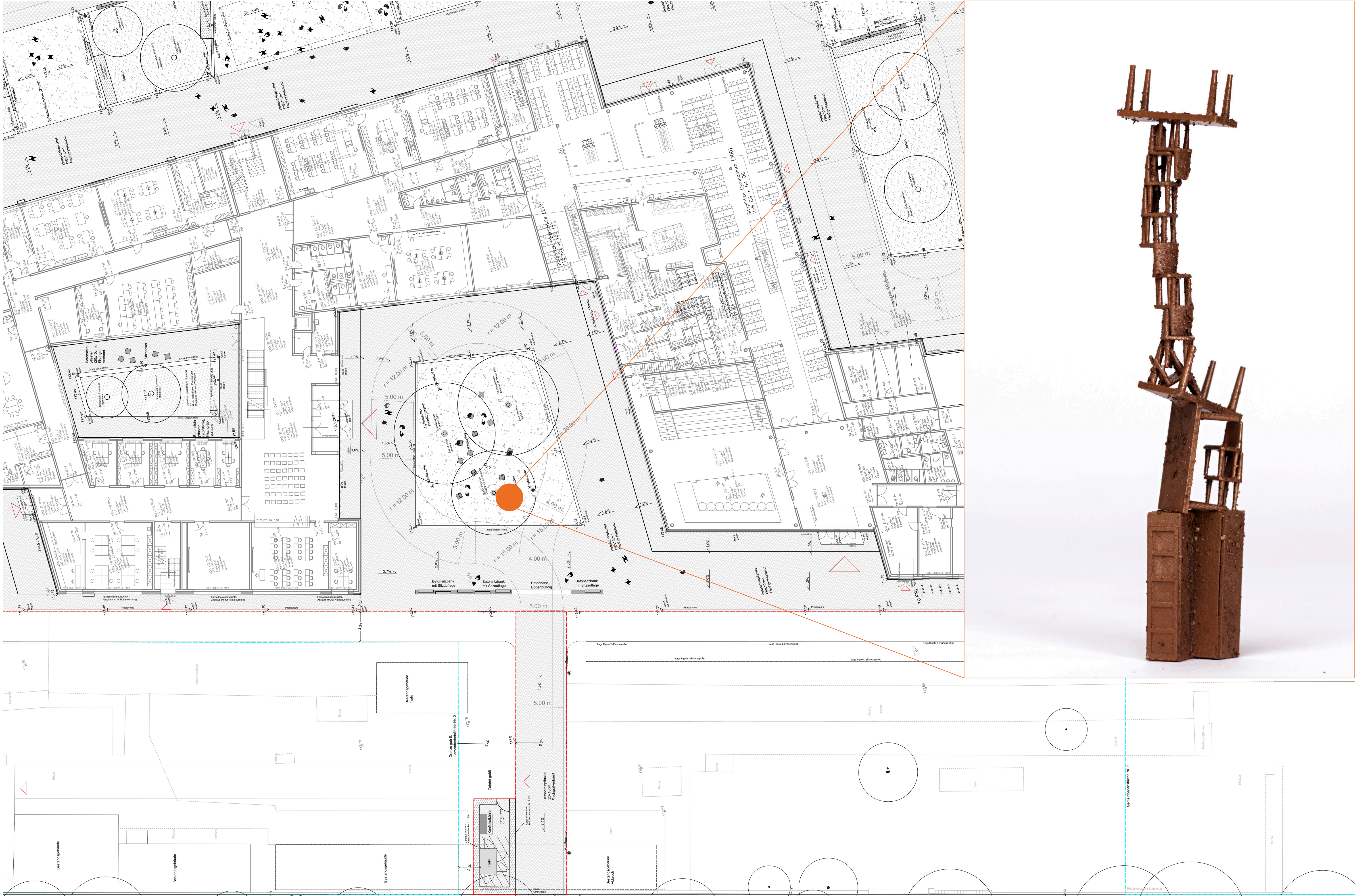
1. Planzeichnung mit Platzierung im Maßstab 1:200