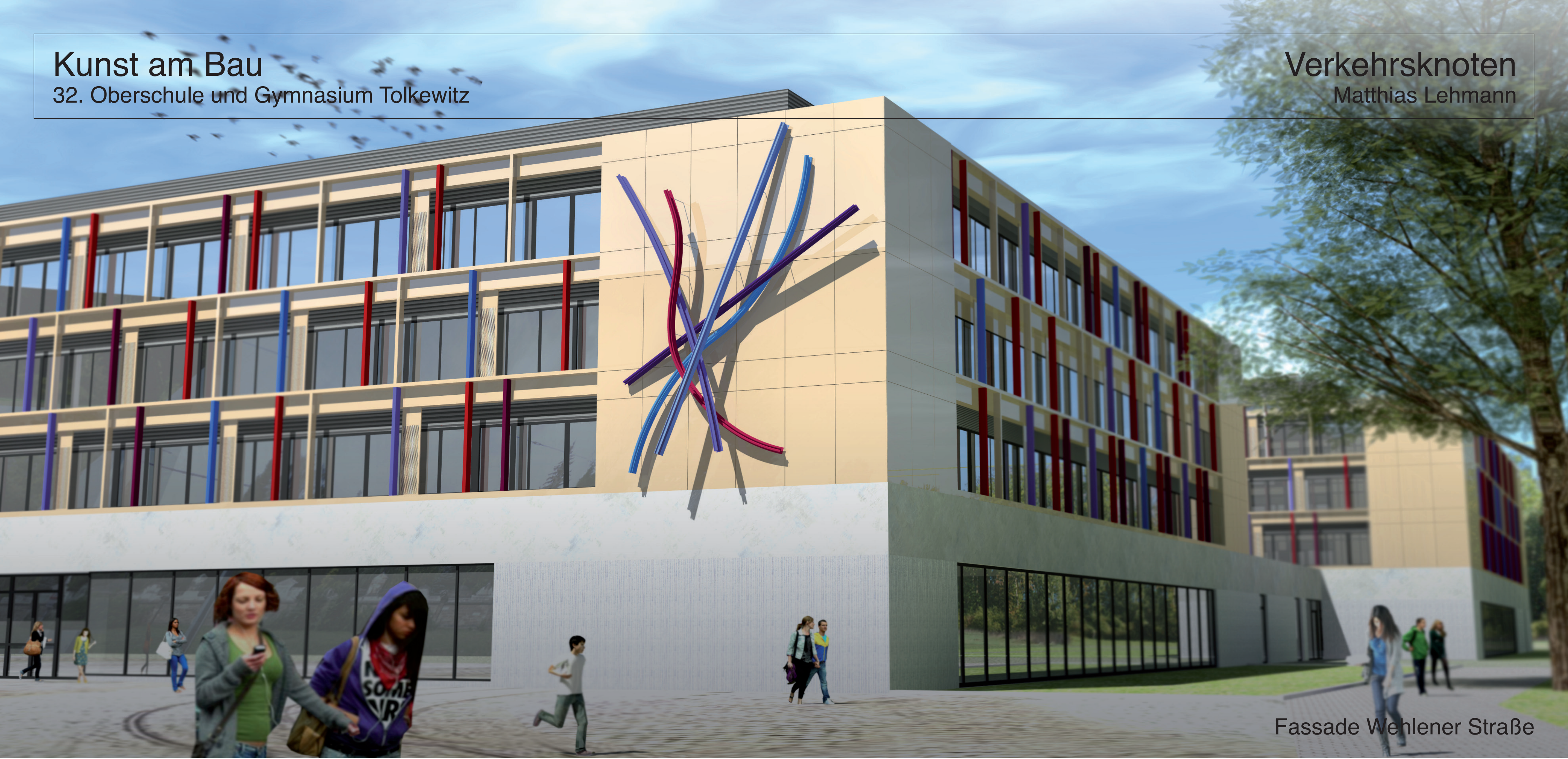
Fassade Wehlener Straße