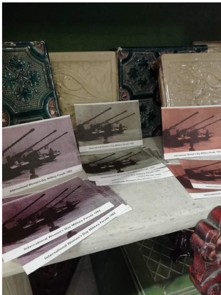
Im Kulturzentrum/Laden „Besousan Han“