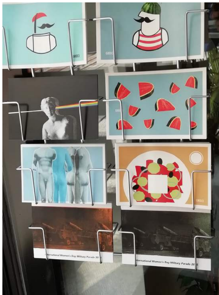
Gemeinsam mit anderen lokal produzierten Postkarten im „Thessaloniki Souvenir Store“