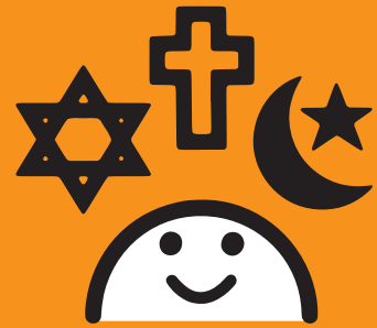
GEDANKEN- & RELIGIONSFREIHEIT