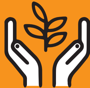
SCHUTZ DER PRIVATSPHÄRE