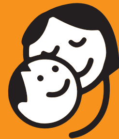
UMGANG MIT BEIDEN ELTERN