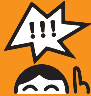
BERÜCKSICHTIGUNG DES KINDSWILLENS