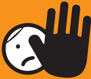
SCHUTZ VOR GEWALT