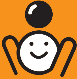
FREIZEIT & KULTUR