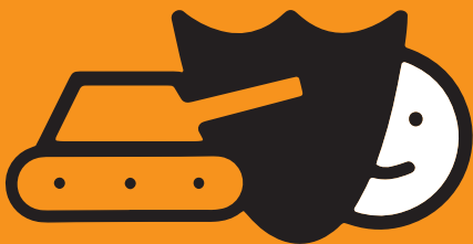
SCHUTZ VOR EINSATZ ALS KINDERSOLDATEN