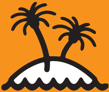
FREIZEIT & ERHOLUNG