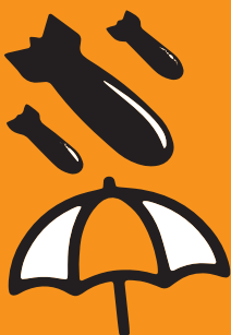
SCHUTZ VOR BEWAFFNETEN KONFLIKTEN