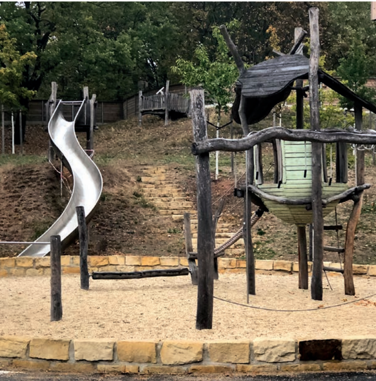
▼ Unser Spielplatz