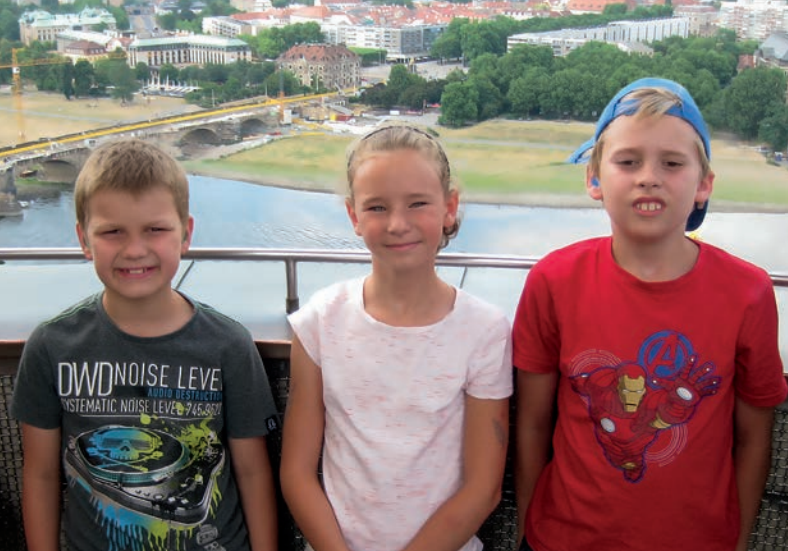
Auf der Aussichtsplattform der Dresdner Frauenkirche