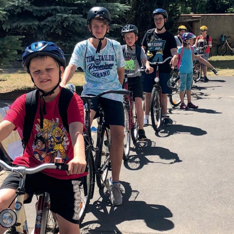
▲ Beim Fahrradausflug