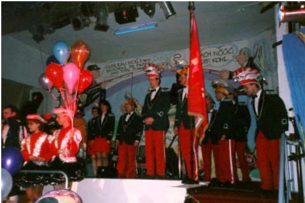
Foto von der Faschingsveranstaltung 2000

Faschingsveranstaltungen in Langebrück haben eine lange Tradition, die bis in die Mitte des 19. Jahrhunderts zurückreicht. Seit 1992 werden sie von dem im gleichen Jahr gegründeten Karnevalsverein, der aus dem alten Elferrat hervorgegangen ist, gestaltet. Sie erfreuen sich großer Beliebtheit, auch in der Umgebung Langebrücks. Im Jahr 2000 mußten sie erstmals in das Kurhaus Klotzsche verlegt werden, da der bisherige Veranstaltungsort, der Speisesaal der Schule, nicht mehr verfügbar war. Die mit dem Ortswechsel aufgetretenen Probleme sind von den Veranstaltern gut bewältigt worden. Das beweisen die Besucherzahlen zum Fasching 2000. An vier Abenden, einem Seniorenfasching und einem Kinderfasching (Teilnahme kostenlos!) besuchten rund 2000 Gäste diese Veranstaltungen. Der Karnevalsverein hat wesentlichen Anteil an der Ausgestaltung der jährlichen Bad- und Sportfeste im Ort.