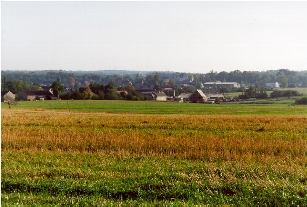
Gelände auf dem Lösigberg vor Baubeginn