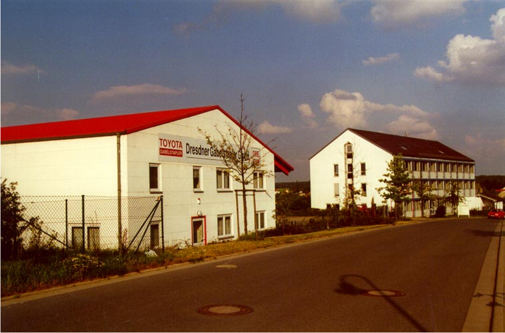
Dresdner Gabelstapler GmbH - rechtes Gebäude: Schalltechnisches Planungsbüro Müller BBM GmbH