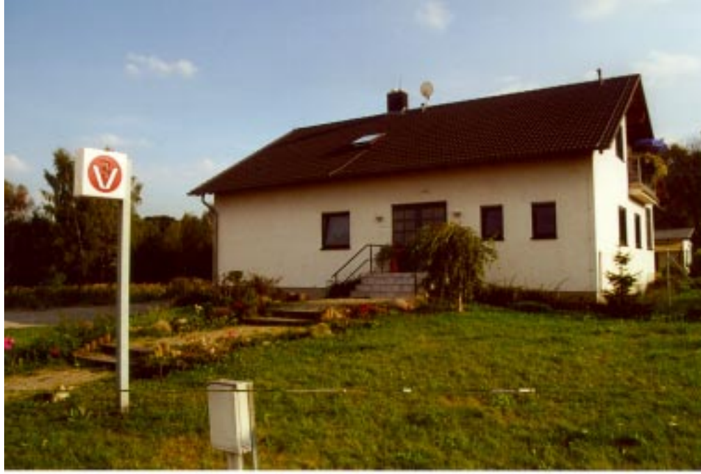
Tierarztpraxis, Tierpension und Wohnhaus Ehrlich