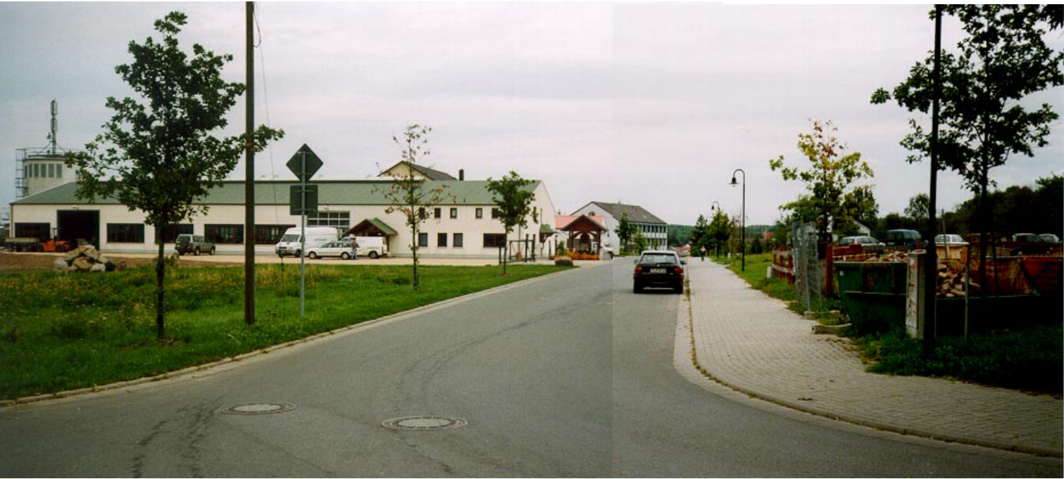
Blick auf das Gewerbegebiet