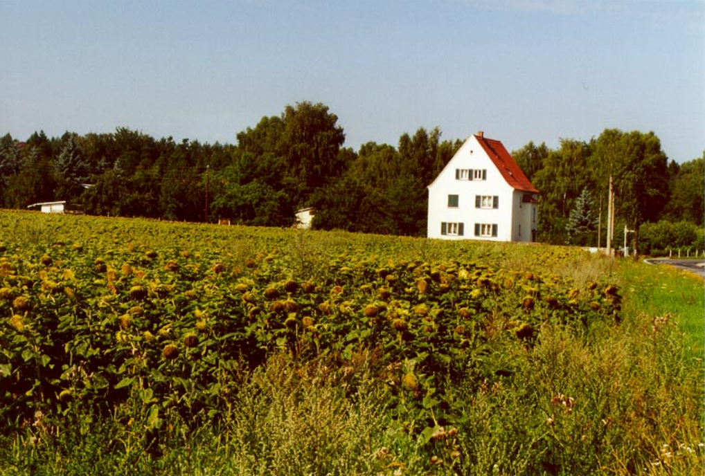
Foto: Sonnenblumenfeld an der Dresdner Straße

Im Dezember 1998 gab es in Langebrück folgende Gewerke (Stand 18.12.1998):