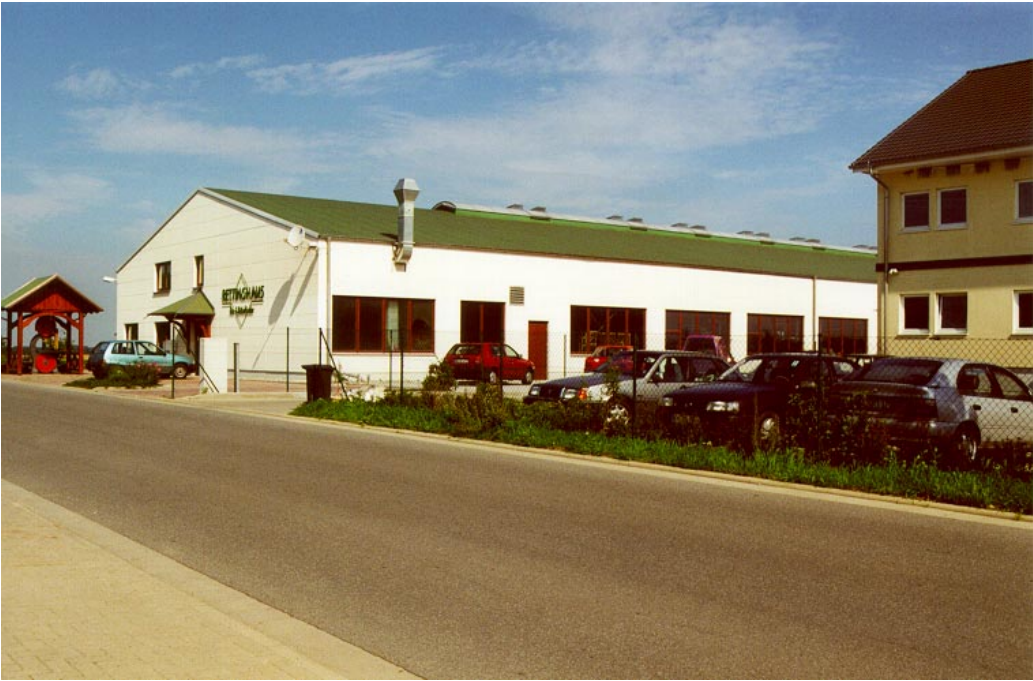
Bau- und Möbeltischlerei Rettinghaus