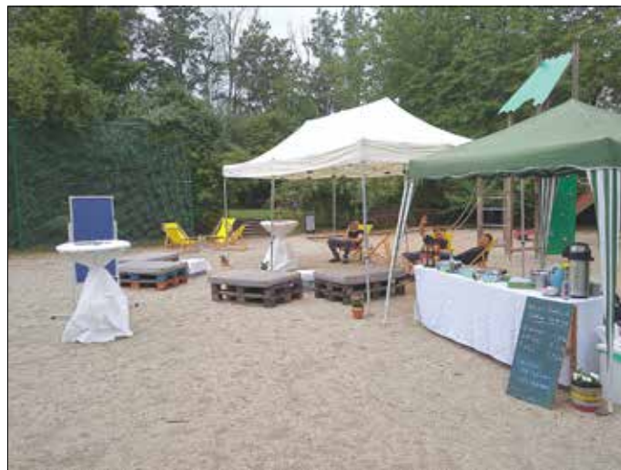
Blick auf unser Eintagscafé

Dafür verwandelten wir den Spielplatz Haufes Berg für einen Nachmittag in ein gemütliches Café. Es gab Sitzplätze, Liegestühle, Kaffee, Kakao und Kuchen. Besonders freuten wir uns über die Kuchen Spenden von Altfränkener Bürgern und Bürgerinnen. Auch wenn wir mitten in der Urlaubszeit vor Ort waren, fanden doch einige Interessierte den Weg zu uns und machten diesen Nachmittag zu einer gemütlichen Runde. Nebenbei stellten wir unsere Pläne und Visionen für einen Kindertreff in Altfranken vor und fragten auch die Anwesenden, was sie sich denn wünschen und wobei sie unterstützen könnten. Einige Rückmeldungen haben wir bekommen, freuen uns aber dennoch über weitere in den nächsten Wochen. Denn ab Dienstag, dem 07.09.2021, werden wir wöchentlich in Altfranken ein Angebot für Kinder und Familien anbieten. Dafür suchen wir tatkräftige Unterstützung, die uns an diesen Nachmittagen unter die Arme greifen können. Los geht es immer ab 15 Uhr auf dem Spielplatz Haufes Berg. Bei schlechtem Wetter werden wir eine Ausweichmöglichkeit haben.