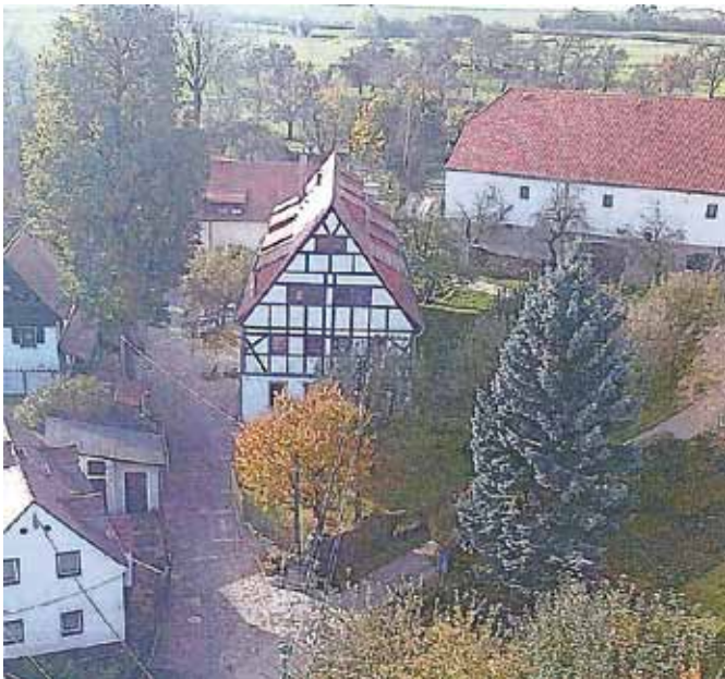
Blick vom Unkersdorfer Kirchturnm auf die ehemalige Pfarre November 2014

des Landesvereins Sächsischer Heimatschutz e. V.