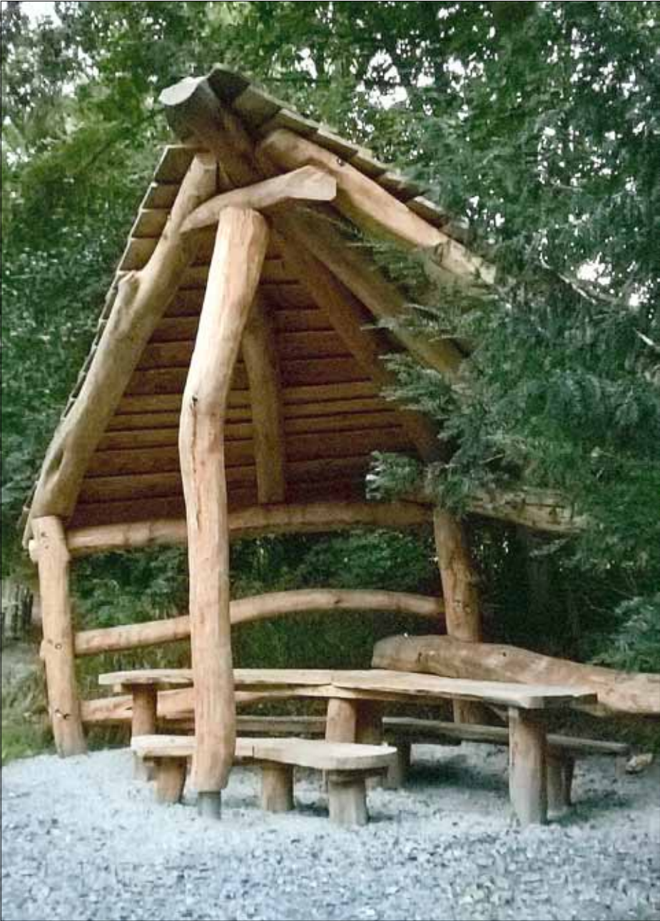
Sitzgruppe im Zschonergrund Podemus