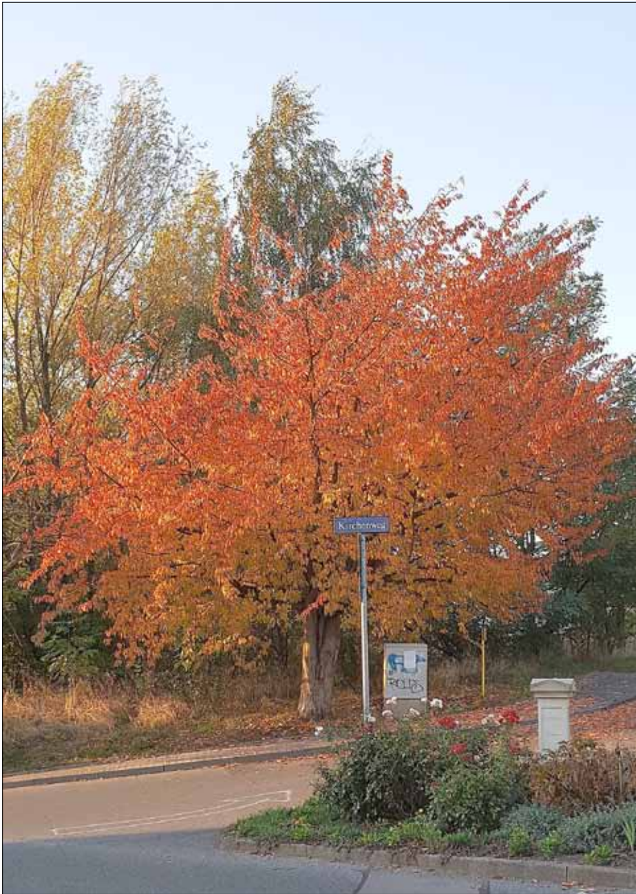
Herbst in Mobschatz