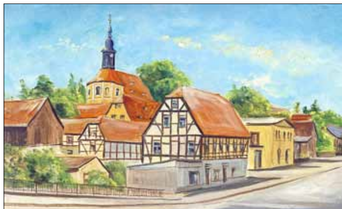
Kesselsdorf, Ölbild 2018

Unser Freund, der Künstler Steffen Gröbner, stellt wieder einmal Bilder im Kesselsdorfer Dorfgemeindehaus, Schulstraße 2 beim dortigen Heimatkreis Kesselsdorf aus. Die Ausstellung wird am Sonntag, dem 11. November 2018 um 14 Uhr eröffnet. Sie sind herzlich eingeladen.