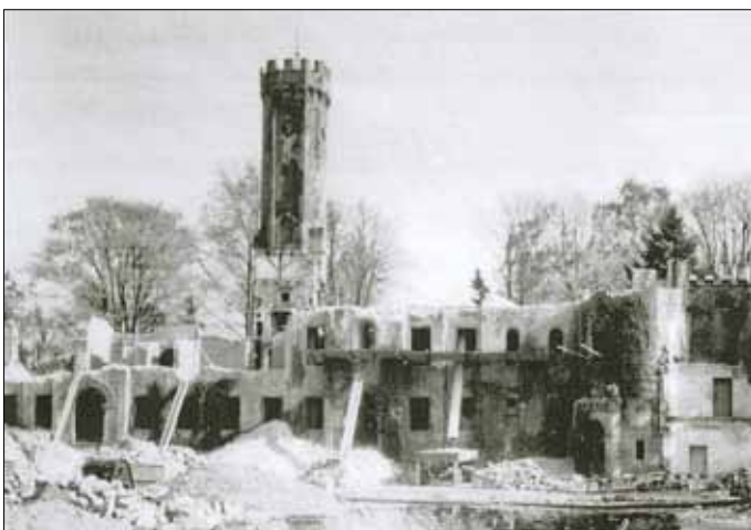
Abriss Schloss Altfranken 1939/40