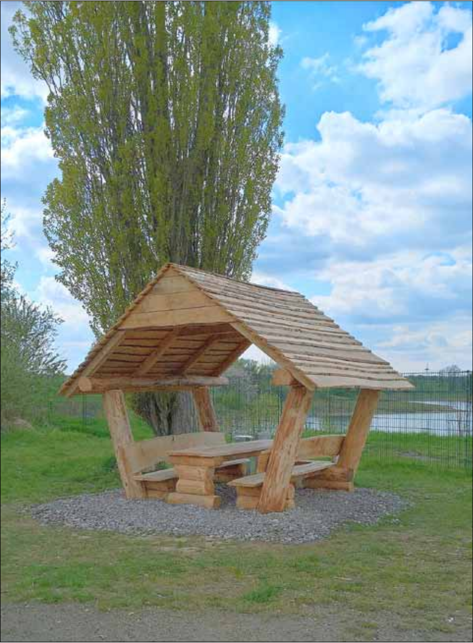
Sitzgruppe in Rennersdorf