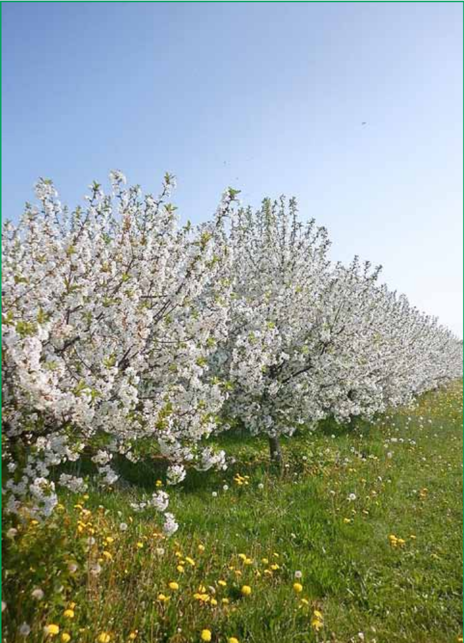
Kirschblüte in Pennrich