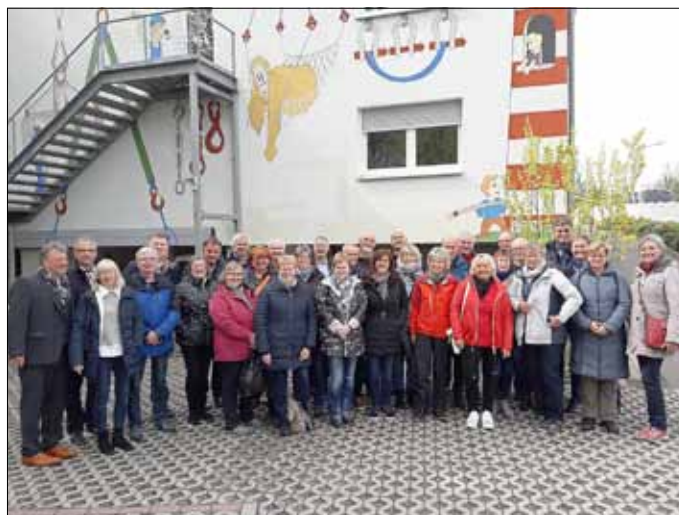
Gruppenfoto TSV VB26 in Görlitz