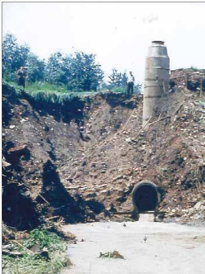
Gorbitzbach, Dammbruch/Zustand 7. Juli 1958