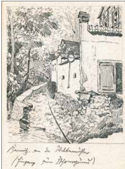
Kemnitz: an der Weltmühle (Eingang zum Zschonergrund)/Bleistiftskizze von Richard Bernhardt - Sammlung Heimatstube

Zuvor seien noch einige Regenmengenwerte genannt. Das Niederschlagszentrum befand sich im Raum Tharandt/Dresden. Die Niederschlagssumme (24 Stunden) lag am 5. Juli 1958 am westlichen Rand Dresdens bei 101 bis 112 mm pro m 2 (Quelle: Kachelmannwetter ). Zwischen dem 3. und 6. Juli 1958 sollen etwa 190 mm pro m 2 Regen gefallen sein (Quelle: Wikipedia ). Das sind 190 Liter pro Quadratmeter.