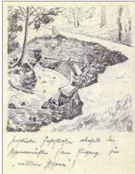
Zerstörte Straße oberhalb der Zschonermühle (am Eingang zur „wilden Zschone“/Bleistiftskizze von Richard Bernhardt - Sammlung Heimatstube