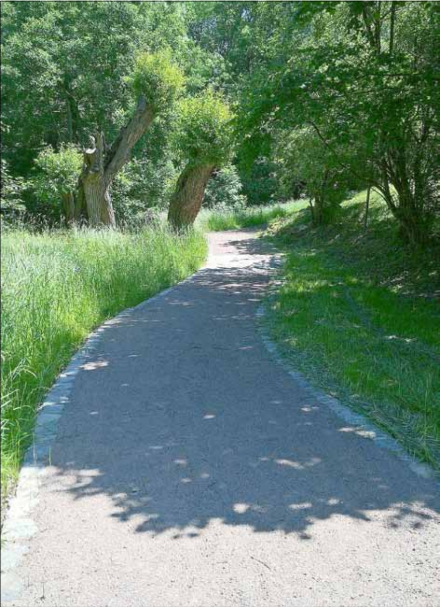
Sanierter Weg in Alt-Leuteritz