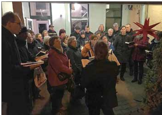
Briesnitzer Chor