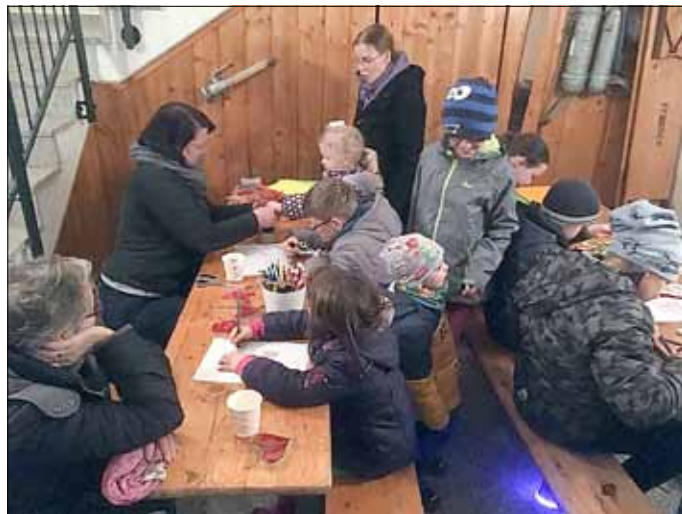
Bastelstube, Foto: Kay Lommatzsch

Die Kinder hatten viel Spaß in unserer Bastelstube und viele Besucher kamen gleich mit eigener Laterne, um sich das Licht nach Hause zu holen. Wir freuten uns über das große Interesse und dankten allen für die sehr schöne, friedliche, weihnachtliche Stimmung.