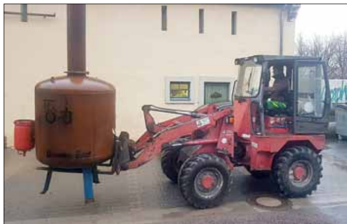
Anfahrt Feuerschale