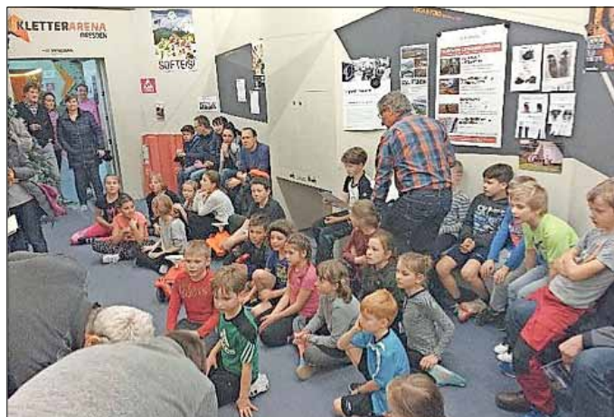
Unsere jüngsten Leichtathleten bei der Weihnachtsfeier in der Kletterarena

Am 23.12.2017 feierten 40 Sportler/innen unserer Leichtathletikabteilung in der Kletterarena Dresden ihren Jahresabschluss. Nach einer Erwärmung ging es die nächsten 2 Stunden durch verschiedenartige Kletterbereiche an den Wänden hoch her. Der Weihnachtsmann überreichte für alle Kinder und Jugendliche verschiedenfarbige Trainingsmützen. Und auch die Trainer bekamen von den Sportlerfamilien ein kleines Überraschungsgeschenk.