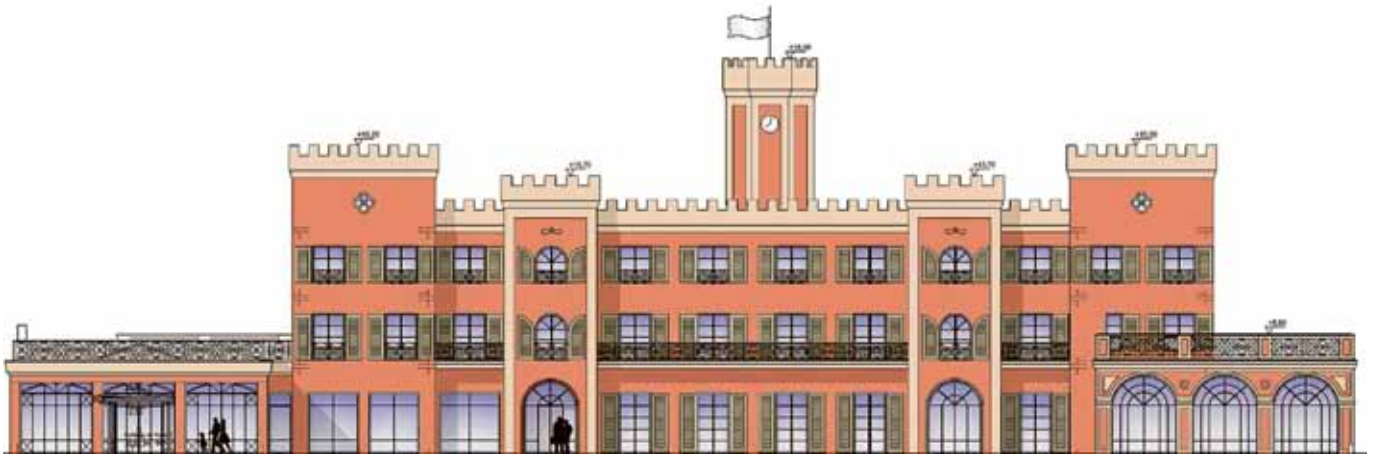
Das Schlosshotel in der Vorderansicht von Nordwesten. Links befindet sich das Bistro, rechts ein großer Saal.

Illustration: ML Planungsgruppe Lehni