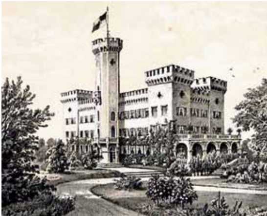
Eine historische Ansicht des Luckner-Schlusses