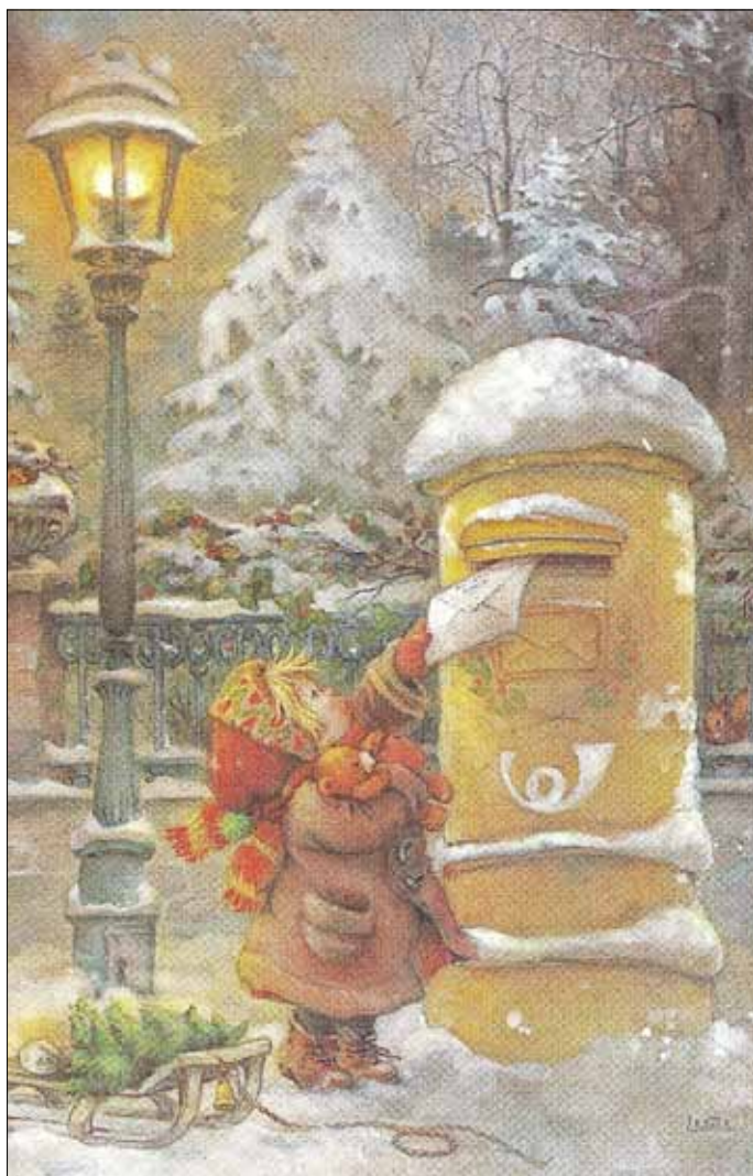
„Wunschbriefkasten“ Ansichtskarte aus der Sammlung Worms (Lisi Martin, Pictura Graphica Karlsbad, Printed in Sweden)