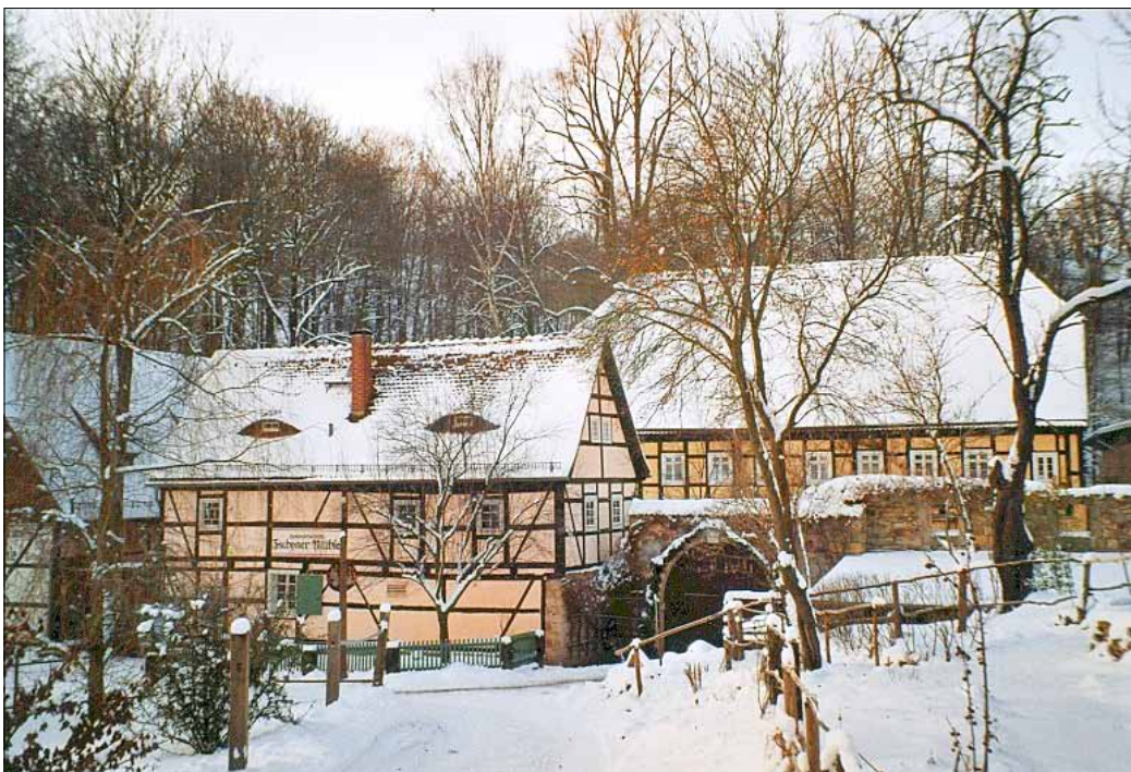
Zschonermühle im Winter