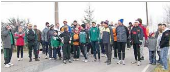
Weihnachtslauf - Foto aus den Vorjahren

Ein kleiner Imbiss und heiße Getränke werden im Anschluss wieder bereitgestellt.