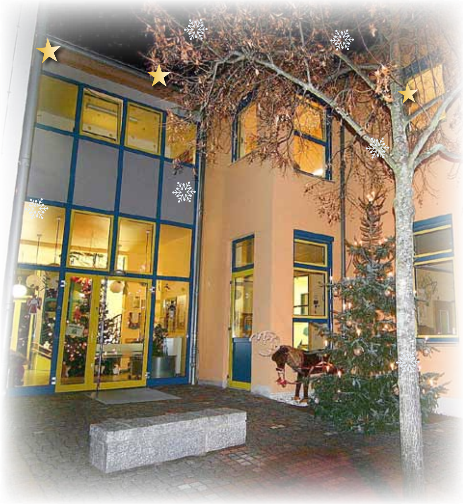
Gompitzer Spatzennest zur Weihnachtszeit