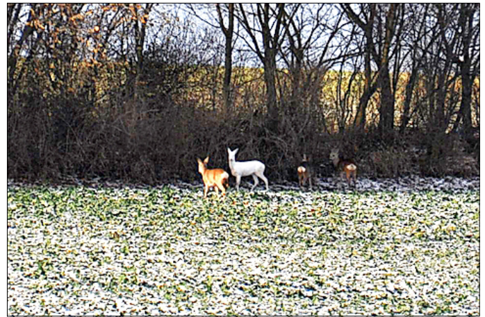
Das weiße Reh bei Unkersdorf