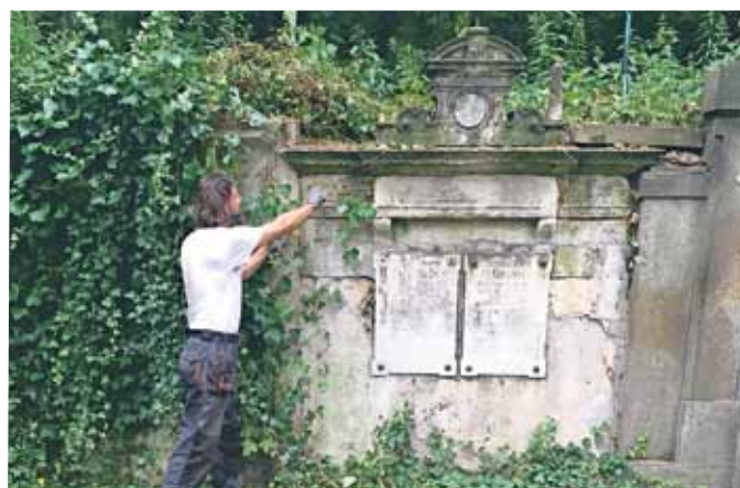
Die Grabanlage nach den landschaftspflegerischen Arbeiten am 12.6.2016.