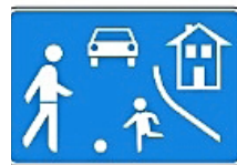
Beginn eines verkehrsberuhigten Bereichs (Verkehrszeichen 325.1)