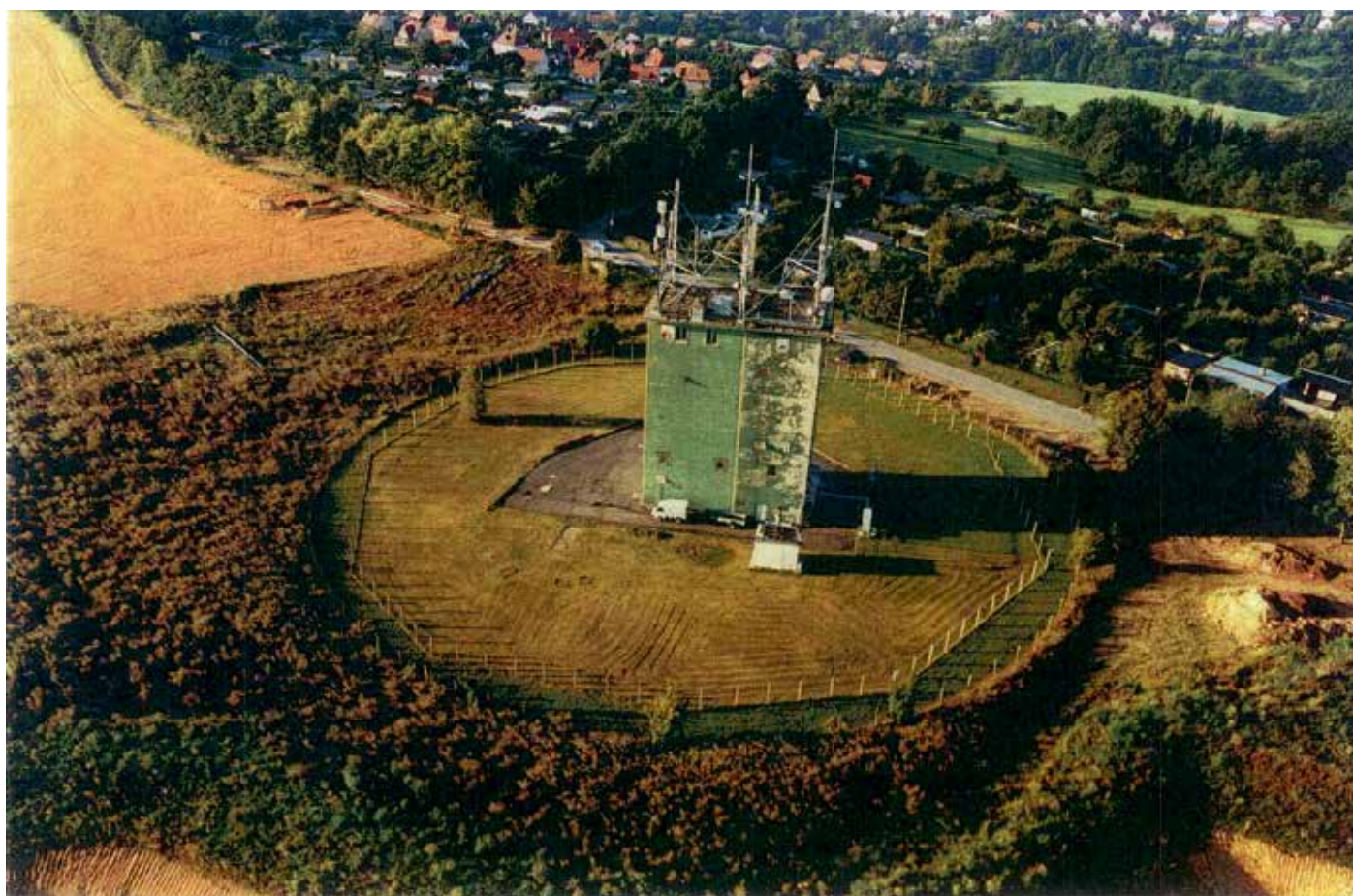
Grüner Turm (2001)

Landesverein Sächsischer Heimatschutz e. V.