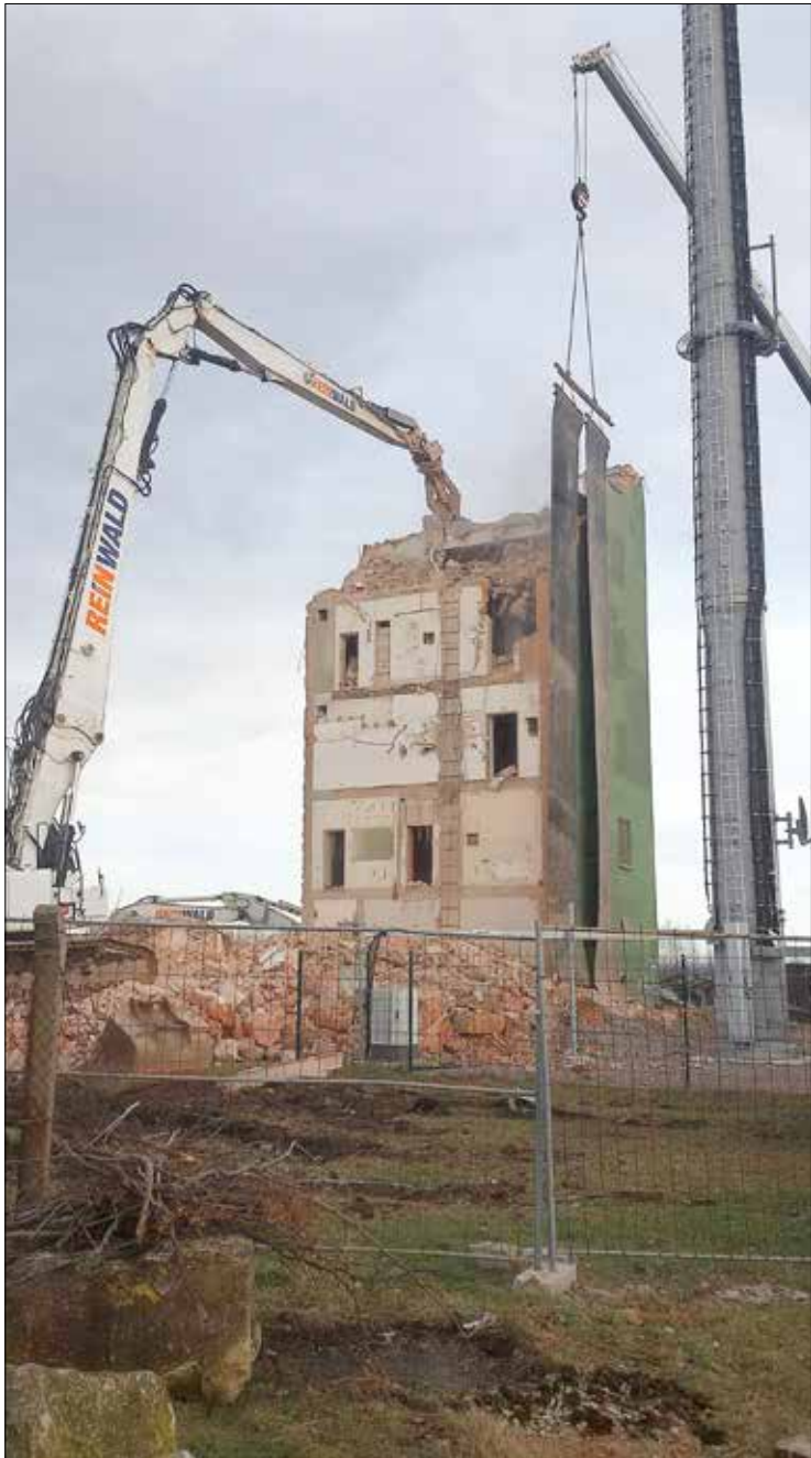
Abriss Grüner Turm, 2021