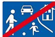
Ende eines verkehrsberuhigten Bereichs (Verkehrszeichen 325.2)