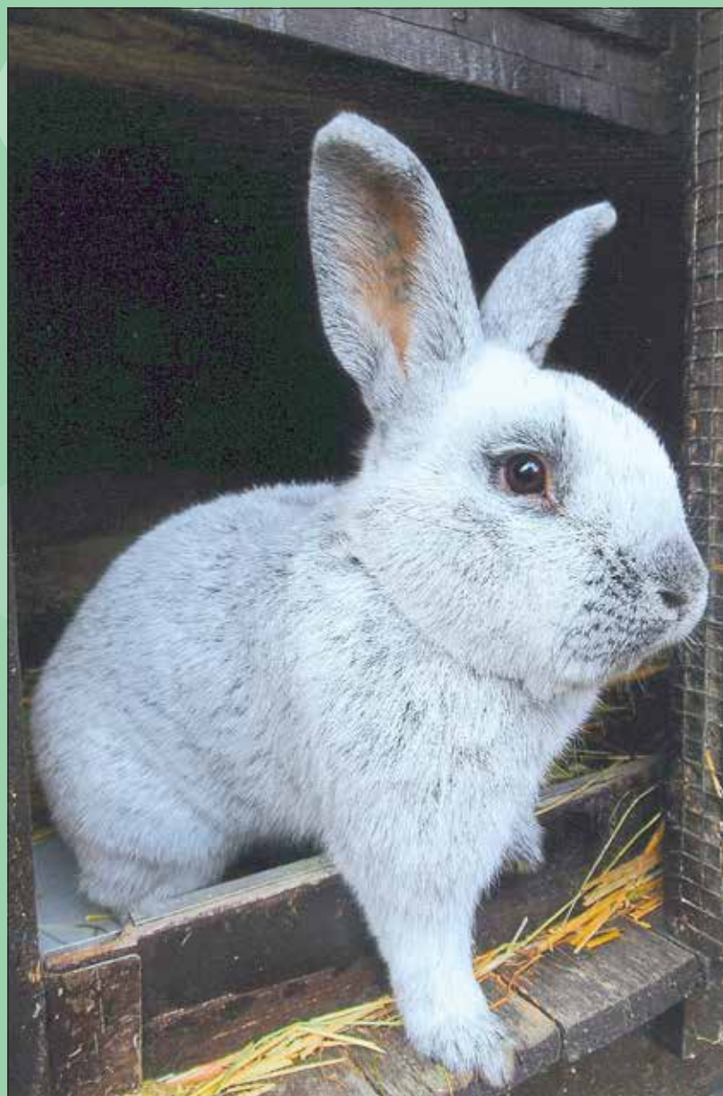
Ostern in Pennrich

Alt-Leuteritz Brabschütz Merbitz Mobschatz Podemus Rennersdorf