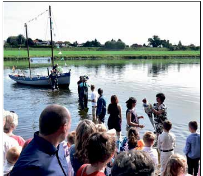
Maritime Zuckertütenübergabe

Schulanfängermutti des Jahrgangs 2025-2026