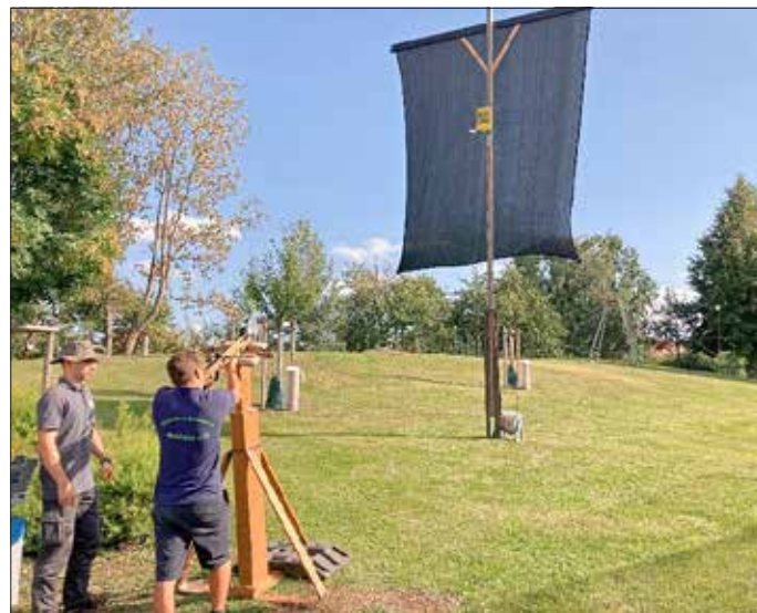
der Schützenkönig beim finalen Schuss

Vorsitzender des Schützenvereins Mobschatz e. V.