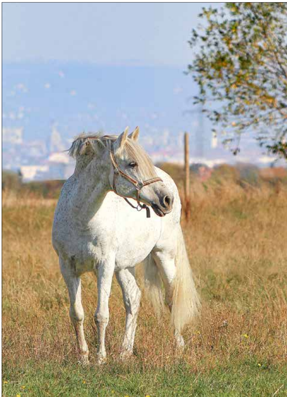
Über der Stadt