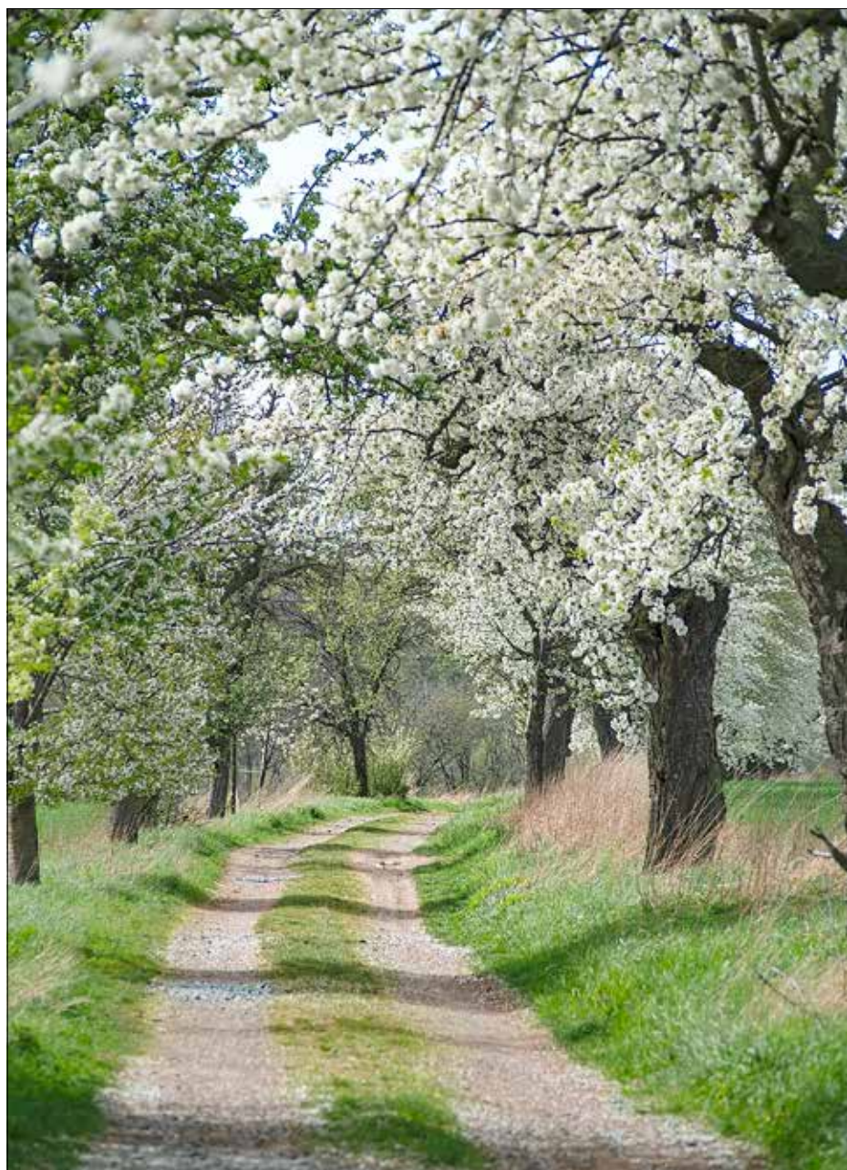
Feldweg in Brabschütz