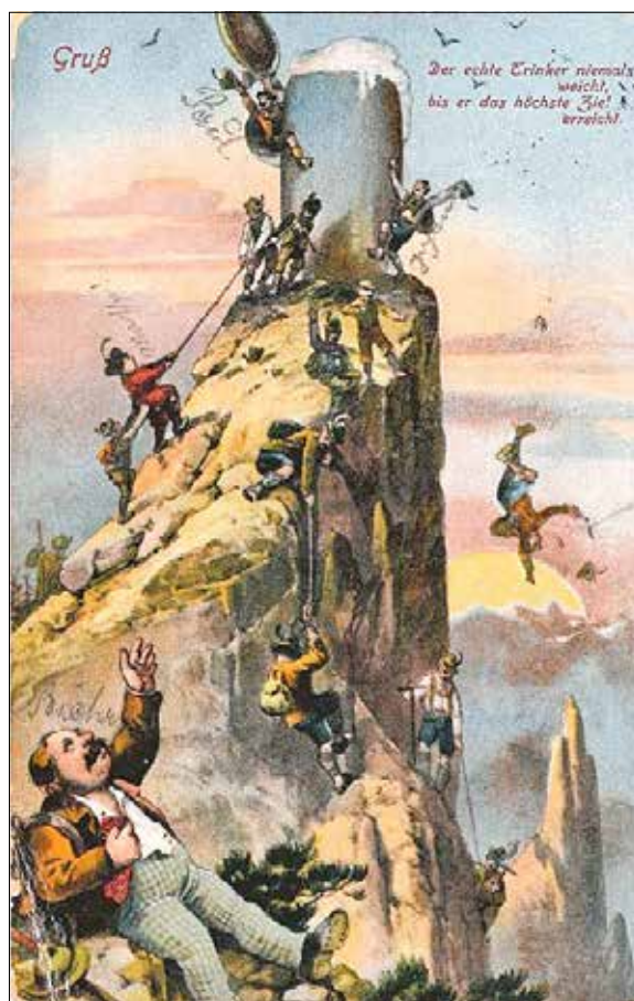
Der echte Trinker niemals weicht, bis er das höchste Ziel erreicht. Grüß-Ansichtskarte von Ottmar Zieher/vor 1914

Ortsgruppe Gompitz im Landesverein Sächsischer Heimatschutz e. V.