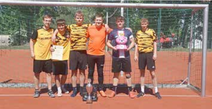
Der Wanderpokal geht diesmal an das jüngste Team