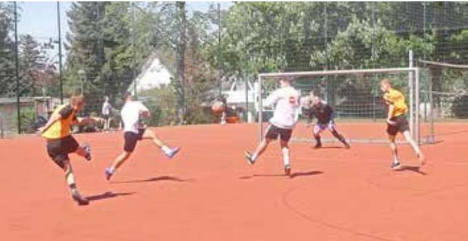
Wir sahen viele gute Spielszenen

Das Fußballturnier im Jahrgang 2025 lief wieder erfreulich fair und bei schönstem Wetter ab. Pokalverteidiger Classic V überzeugte wieder mit einer guten Spielanlage, fing sich aber schon ab dem ersten Spiel durch eigene Fehler Gegentore ein. So wurde es diesmal nur der 5. Platz. Profitieren konnte davon das jüngste Team namens Ostdeutschland, welches die ersten drei Spiele gewann und so vorzeitig als Turniersieger feststand. Erstaunt stellten sie bei der Pokalübergabe fest, dass es das Turnier bereits seit 1997 gibt und man selbst da noch gar nicht auf der Welt war. Um die Plätze 2 bis 5 ging es spannend zu, da sich jedes Team "Ausrutscher" leistete. Mit einem abschließendem 1:0 gegen den Turniersieger kam "Neuling" Bierbauch-Banditen auf Platz 2.