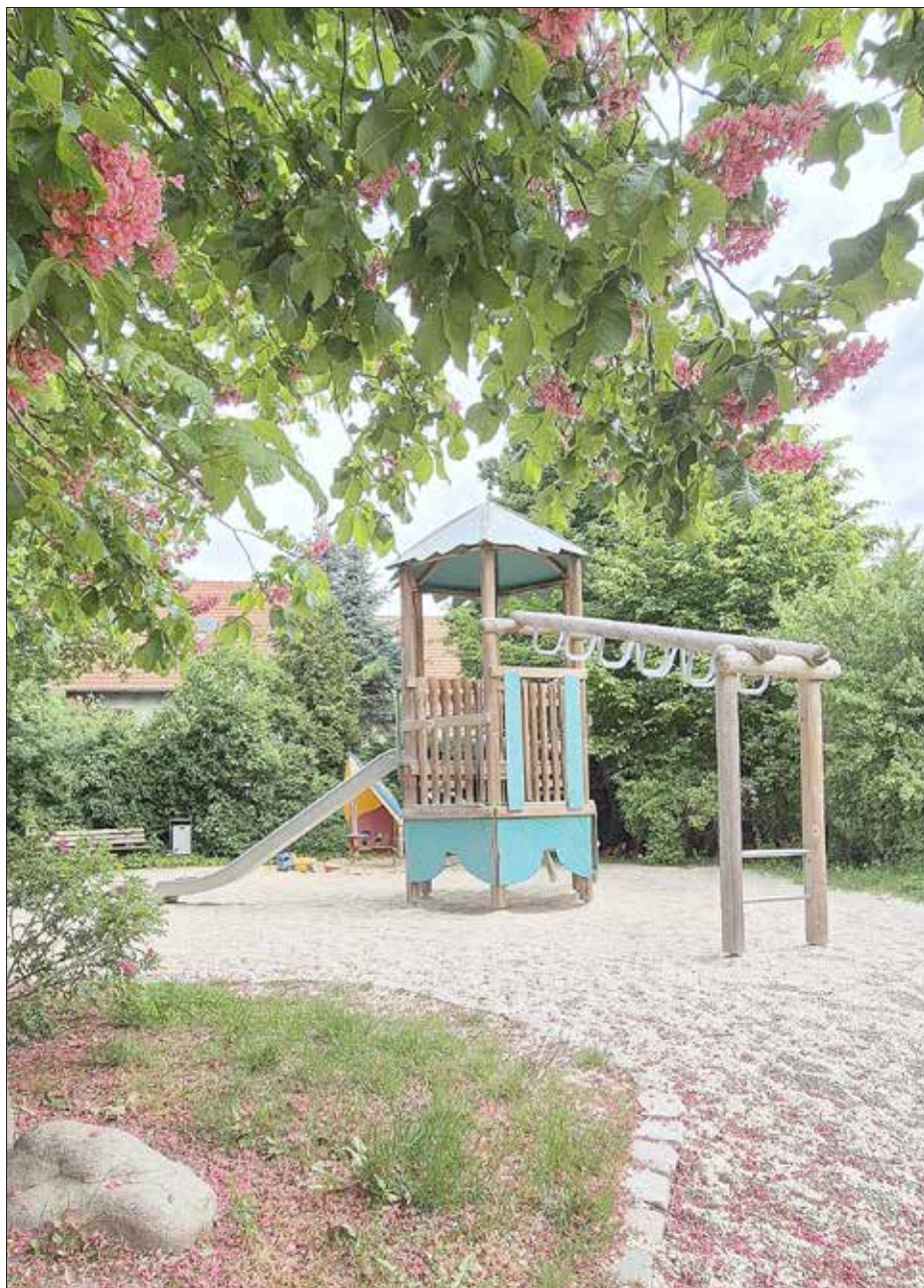
Spielplatz in Ockerwitz