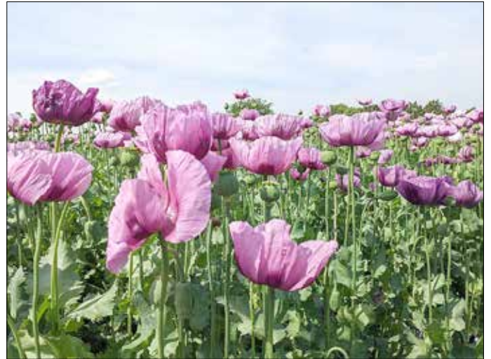
Mohnfeld bei Helbigsdorf Ende Mai 2022

Landesverein Sächsischer Heimatschutz e. V.