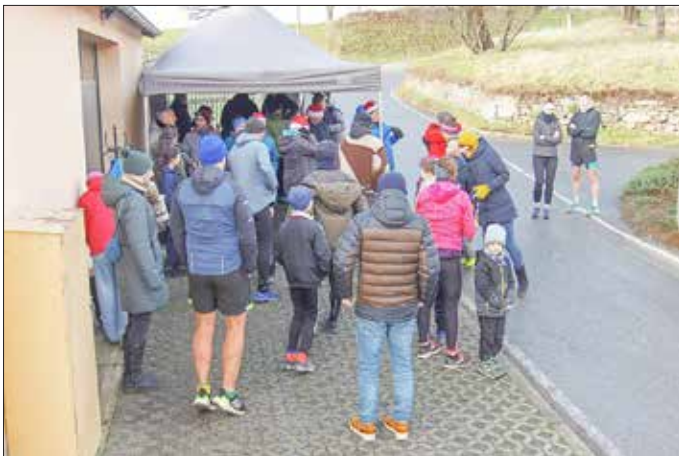
Impression vom Mobschatzer Weihnachtslauf am 15.12.2024

Trotz kalten Temperaturen und einem eisigen Wind haben wieder viele Läuferinnen und Läufer bei diesem Lauf teilgenommen. Im Anschluss wurde noch eine Stärkung bereitgestellt. Wir danken den Bauhofmitarbeitern für Ihre Unterstützung.