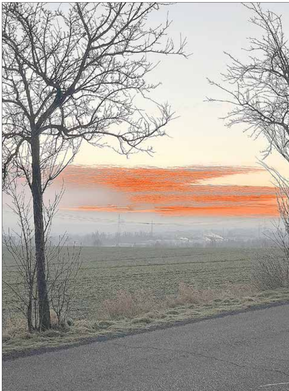
Sonnenaufgang in Ockerwitz