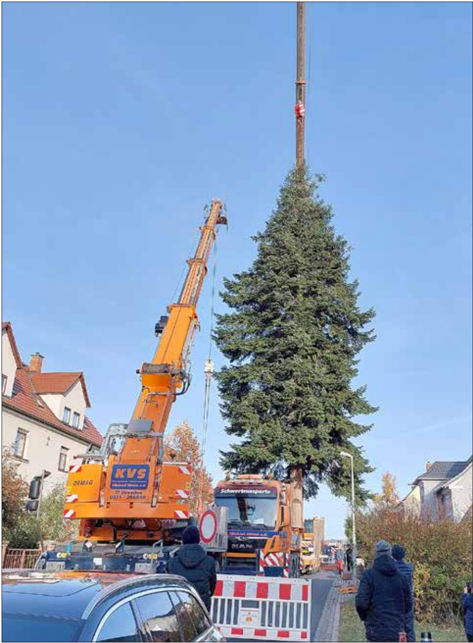
Der Dresdner Weihnachtsbaum kommt dieses Jahr aus Altfranken