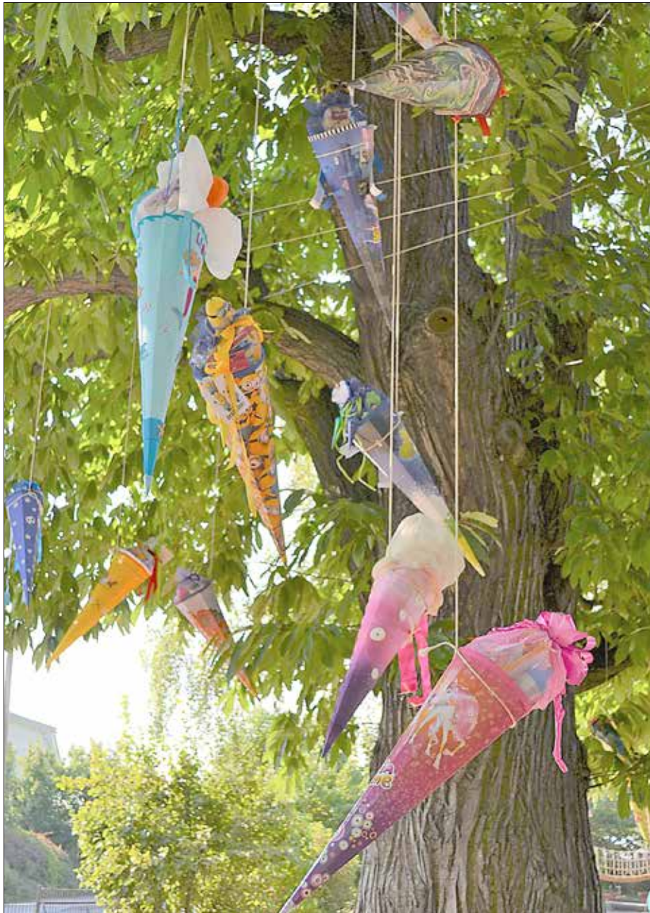
Unser Zuckertütenbaum der 74. Grundschule Gompitz