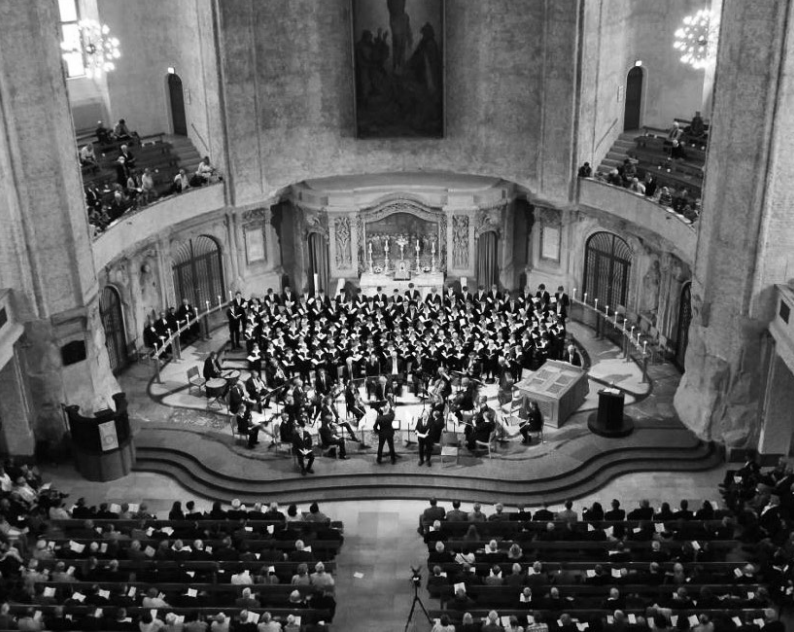
Vesper des Kreuzchores in der Kreuzkirche