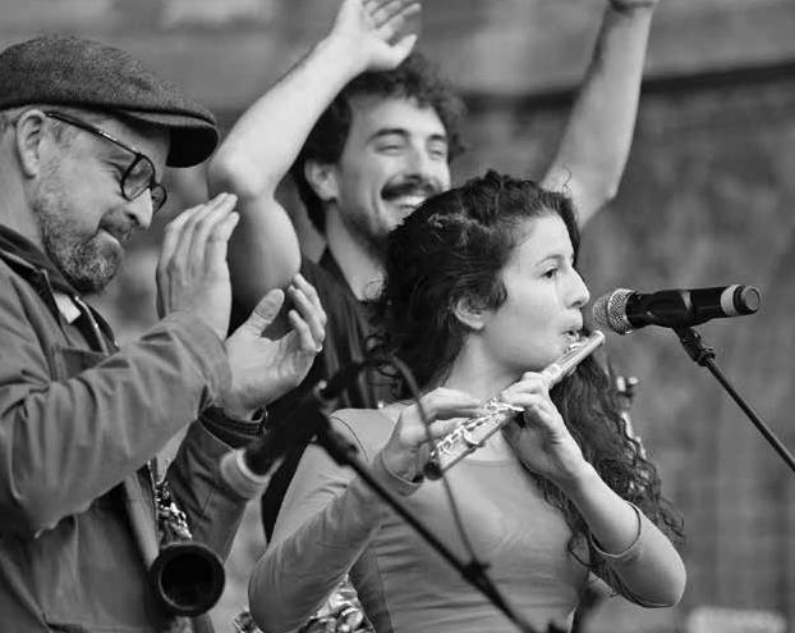
Banda Comunale en el acto de clausura de las 32ª Jornadas Interculturales