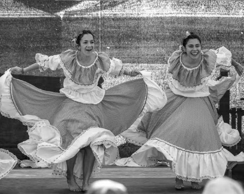
↑ p. 39 : Programme scénique de la fête de rue interculturelle 2022

15h30 - Klotzscher Treff, Göhrener Weg 5