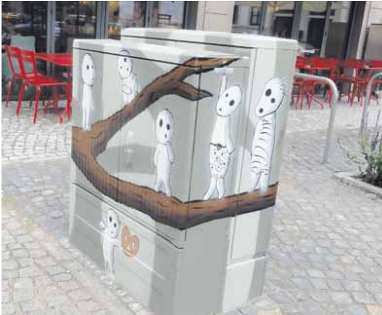
Schaltkasten mit Waldgeister.