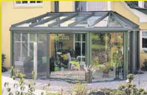
Wintergärten und -beschattung Individueller kann Urlaub nicht sein