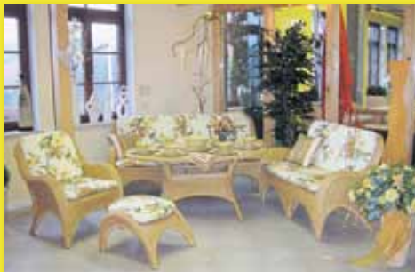
Rattan – das Holz Asiens einzigartig für phantasievolle Möbelformen

Jetzt mit „Herbstrabatten“ planen – im Frühjahr montieren!!!