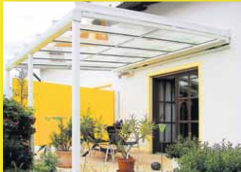
Terrassendächer Genießen Sie Behaglichkeit zu jeder Jahreszeit