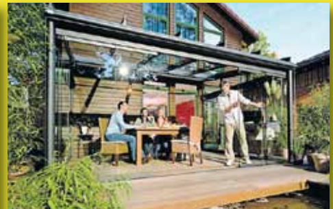
Glasoase – Verglasungen mit Schiebeanlagen Für jeden Anspruch das Richtige!