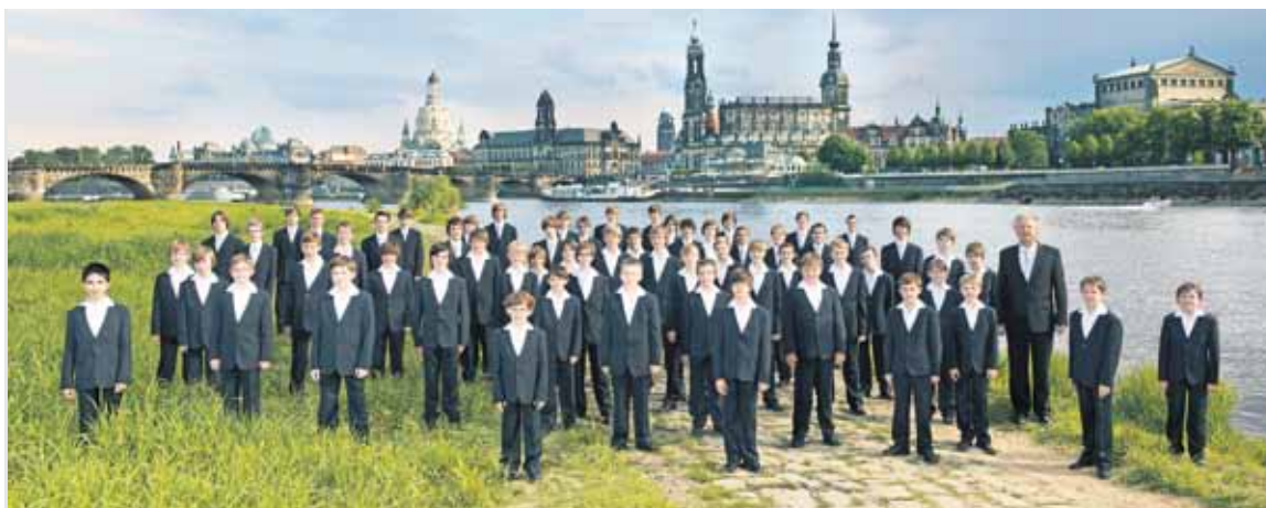
Am der Elbe. Der Kreuzchor mit dem Kreuzkantor auf dem Neustädter Elbufer vor der Silhouette der Dresdner Altstadt.