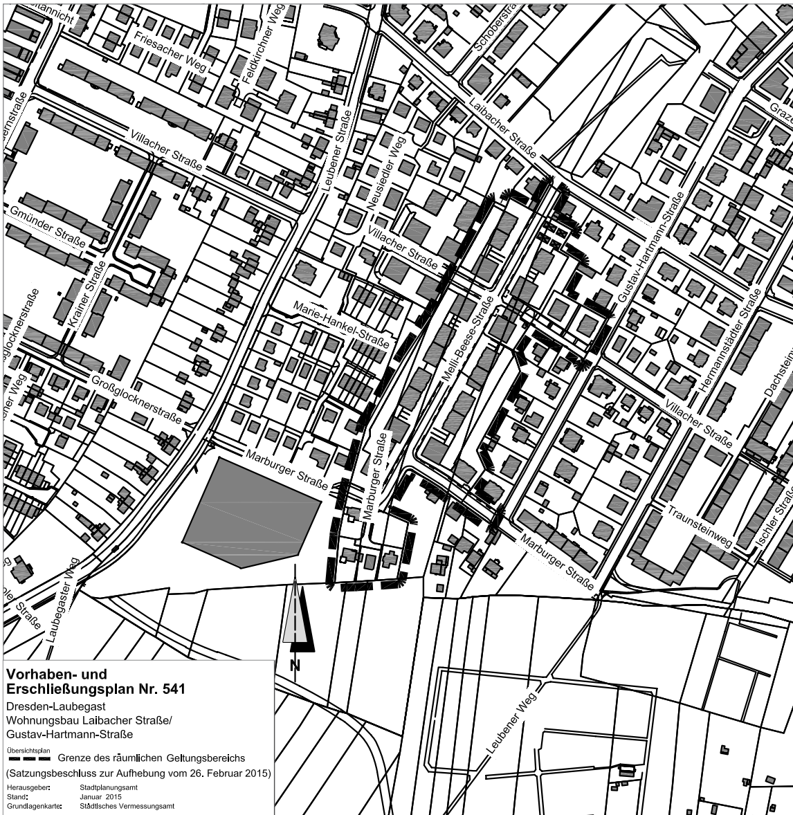
Vorhaben- und Erschließungsplan Nr. 541 Dresden-Laubegast Wohnungsbau Laibacher Straße/ Gustav-Hartmann-Straße Übersichtsplan --- Grenze des räumlichen Geltungsbereichs (Satzungsbeschluss zur Aufhebung vom 26. Februar 2015) Herausgeber: Stadtplanungsamt Stand: Januar 2015 Grundlagenkarte: Städtisches Vermessungsamt