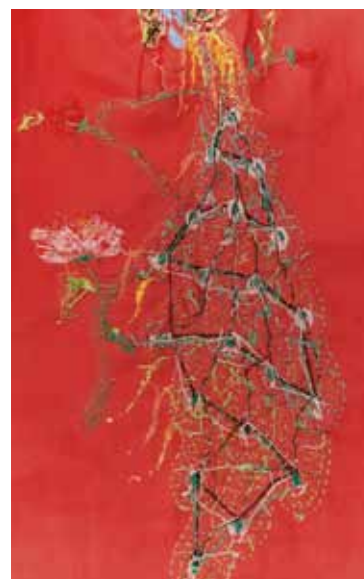
aus der Serie: „Die andere Seite“, 2015 100 x 150, c-print