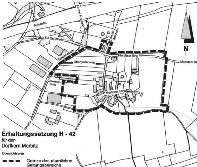
Erhaltungssatzung H - 42 für den Dorfkern Merbitz

Wer eine bauliche Anlage in dem durch diese Satzung bezeichneten Gebiet ohne die nach ihr erforderliche Genehmigung rückbaut oder ändert, han-