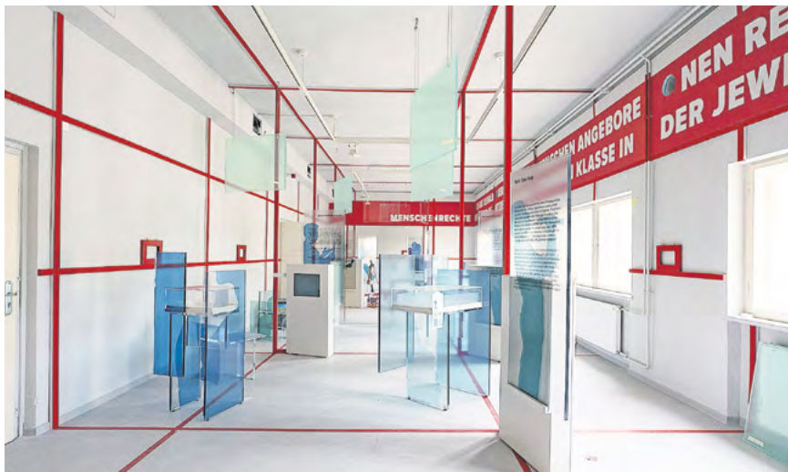
Zeitzeugnisse. Blick in einen der neu gestalteten Räume der multimedialen Dauerausstellung.