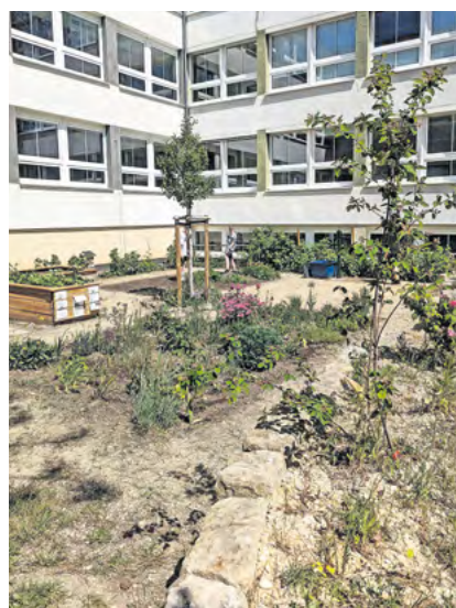
Schulgarten an der Oberschule Cossebaude.

Kultus-Amtschef Wilfried Kühner überreichte am 7. Juni den vier Preisträgern die Urkunden, Plaketten für die Hauswand und das Preisgeld von jeweils 2.500 Euro bzw. 1.500 Euro. Insgesamt hatten sich 64 Schulen an dem Wettbewerb beteiligt. Der dreistufige Wettbewerb startete im Mai 2022. Erstmals waren berufsbildende Schulen eingeladen, sich am Wettbewerb zu beteiligen. Bei einem Besuch in den Gärten der zehn Finalisten im Mai 2024 wurden die Landessieger und Sonderpreisträger ermittelt. Die Jury bestand aus Schulpädagogen, Landschaftsarchitekten, Vertretern des Landesamtes für Schule und Bildung sowie des Kultusministeriums und der Landesstiftung Natur und Umwelt.