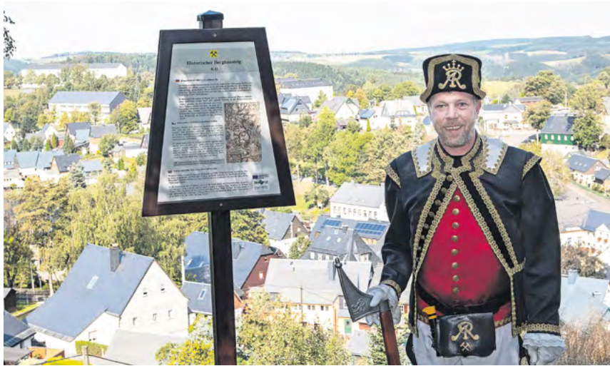
Historischer Bergbausteig mit fantastischem Blick über Seiffen

Entlang des Bergbausteigs führt ein aussichtsreicher thematischer Wanderweg. Über mehrere Jahrhunderte hinweg prägte der Erzabbau die Region – seine Spuren sind noch heute vielerorts zu erkennen. In den 1980er-Jahren legte die Bergbauforschungsgruppe den Lehrpfad an. Es gibt zwei verschiedene Routen, beide beginnen an der Pinge „Geyerin“ oberhalb der Seiffener Bergkirche. Die kleine Runde führt an 28 Stationen durch das bergbauliche Zentrum Seiffens und dauert ungefähr eine Stunde.