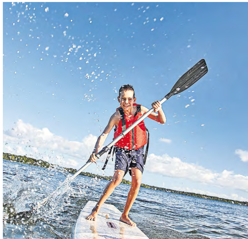
Beim Klettern einfach mal über sich hinauswachsen, sich von Shows unterm Zeltdach beeindruckt lassen oder das nasse Element herausfordern – erlaubt ist, was gefällt.