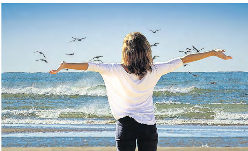
Urlaub ist tatsächlich auch Urlaub für die Seele.

Und: Was gibt es schließlich Schlimmeres, als bei schönstem Winter- oder Sommerwetter im Büro zu sitzen und den herrlichen Schnee oder die Sonne nur durchs Bürofenster zu sehen? Im Urlaub, auf Reisen, können Sonne, Strand, Skipisten und Berge genutzt werden. Bewegung, frische Luft und das Gefühl von Freiheit helfen zudem neben der psychischen Erholung gleich noch für körperliche Frische.