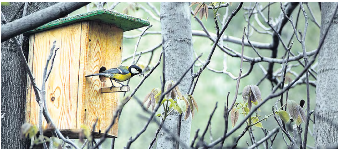
Die meisten Nistkästen haben eine Sitzstange am Einflugloch. Experten raten aber zum Verzicht, um Räubern keinen Vorschub zu leisten.

Zwitschernde Vögel verleihen dem Frühling seinen besonderen Klang – doch weil immer mehr Freiflächen bebaut, Bäume gefällt und Fassaden saniert werden, verlieren die Singvögel Rückzugsräume und Nistmöglichkeiten. „Einen kleinen Teil davon können wir der Natur durch das gezielte Anbringen geeigneter Nistkästen zurückgeben“, sagt Jan-Eric Dreßler, Vorsitzender des Nistkästen für Dresden e. V. „Sie sind sicherlich kein Allheilmittel, aber ein wesentlicher Bestandteil in der Bemühung, Wildvogelarten zu erhalten.“ Wer also einen Garten mit einigen Futterquellen und Nistmaterial besitzt, kann einen Beitrag leisten. Vor dem Bau oder Kauf eines Nistkastens sollte man schauen, welche Vögel im Garten leben – denn die kleinen Häuschen sind auf konkrete Arten zugeschnitten. So zum Beispiel auf Meisen und Rotschwänze, die normalerweise in weitgehend geschlossenen Bruthöhlen nisten und ähnlich geschützte Kästen benötigen. Der Nistkasten sollte mindestens zweieinhalb bis drei Meter über dem Boden hängen, damit Eier und Küken nicht so leicht zur