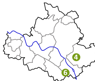
Abbildung 3: Lage Annahmestellen Sperrmüll und Altholz