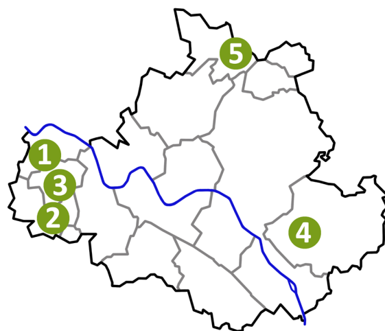
Abbildung 2: Lage Annahmestellen Grünabfall in Dresden