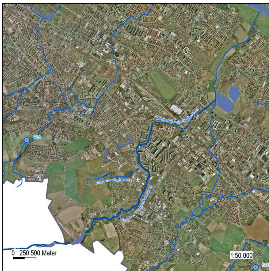
Abb. 1: Prohliser Landgraben/Geberbach